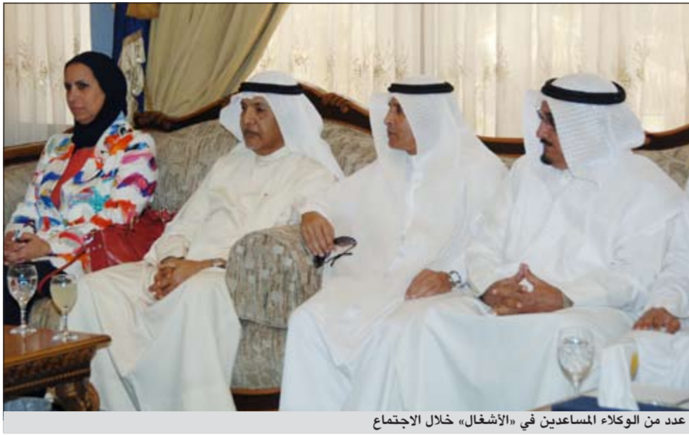
عدد من الوكلاء المساعدين في «الأشغال» خلال الاجتماع

الدعيج: تم بحث أوضاع الطرق الرئيسية التي تربط ما بين الطرق السريعة