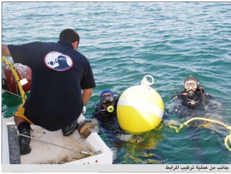
جانب من عملية تركيب المرباط