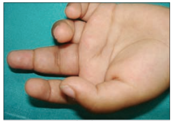
هناك كبسولات لمن يعانون من آلام المفاصل

الشباب تحت سن العشرين تعمل أجسامهم تلقائياً على تجديد الخلايا كل ثمانية وعشرين يوماً