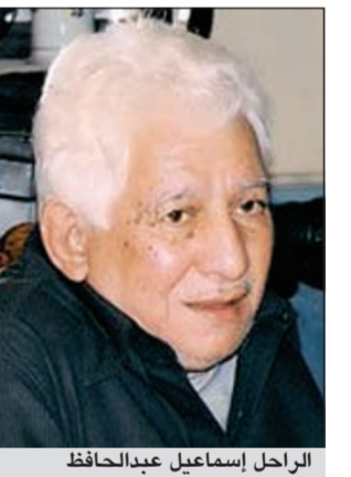
الراحل إسماعيل عبدالحافظ

الاسكندرية - أ.ش.: كرم مهرجان الاسكندرية السينمائي في دورته الثامنة والعشرين اول