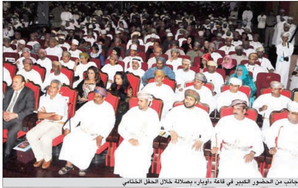
جانب من الحضور الكبير في قاعة «أوبار» بصلالة خلال الحفل الختامي