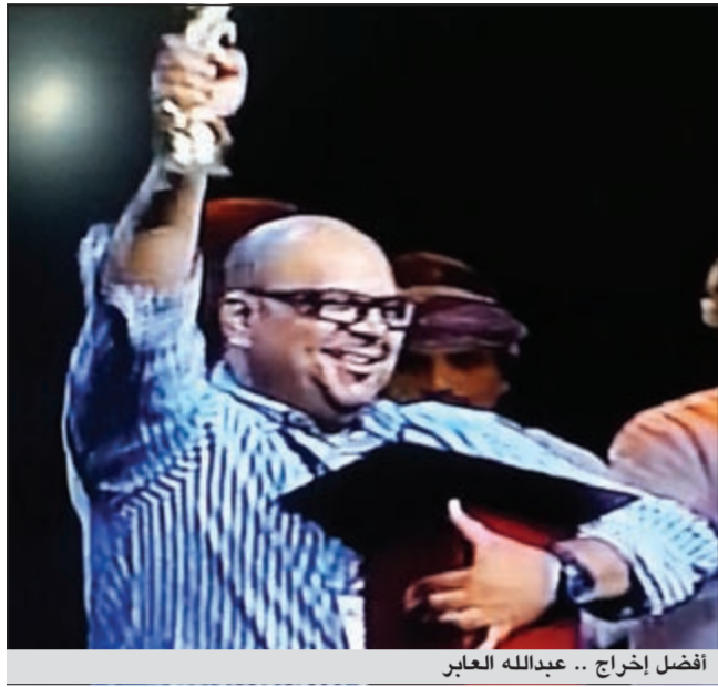
أفضل إخراج .. عبدالله العابر