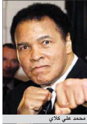
محمد علي كلاي

فيلادلفيا - د.ب.أ: حصل أسطورة الملاكمة محمد علي على جائزة الحرية تقديراً لالتزامه منذ فترة طويلة بالحقوق المدنية والحرية الدينية والقضايا الإنسانية. وتسلم علي السذي يعاني من مرض باركنسون منذ 30 عاماً الجائزة في مركز الدستور الوطني في فيلادلفيا في ساعة متأخرة الخميس الماضي. ولم يتحدث المالك السابق (70 عاماً) خلال تسلمه الجائزة من ابنته ليلي علي وقالت زوجته لوني إنه يعتبر الجائزة تكريماً كبيراً.