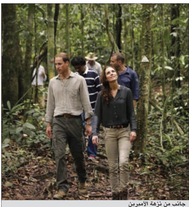
جانب من نزهة الأميرين

وبعد وقت قصير من وصولهما إلى وادي دانوم استمع الزوجان للمكثيان لشرح العلماء عن الجهود الرامية لحفظ وحماية واحدة من الغابات البكر المتبقية في العالم، ومن المقرر أن يقوم الزوجان أيضاً بزيارة مختبر أبحاث، فضلاً عن السير على أحد الجسور بين قمم الأشجار، ويعتزم الأمير ويليام وزوجته كيت قضاء الليلة في مدينة كوتسا كينابالو عاصمة إقليم صباح.