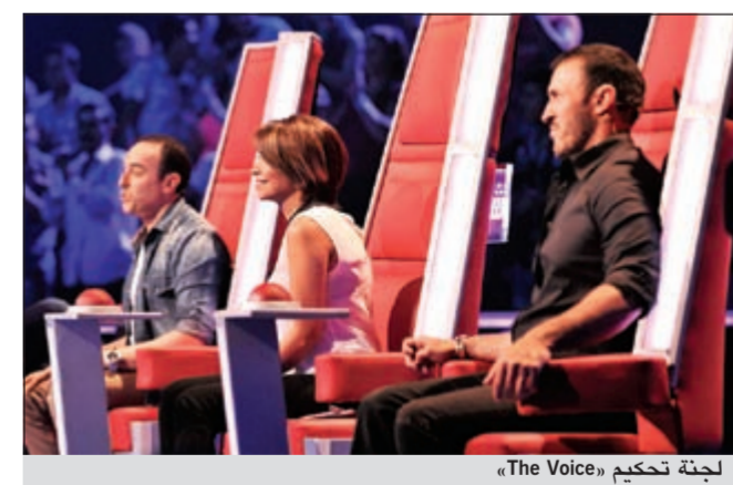
لجنة تحكيم «The Voice»