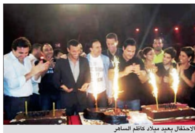
الاحتفال بعيد ميلاد كاظم الساهر

المشتركة وسام القروي بدأت بأداء الـ «opera»، لتواصل بأغنية «يا طيور»، وقد أعجب أداؤها وصوتها لجنة التحكيم، وقال عنها الحلاني إنها تستحق