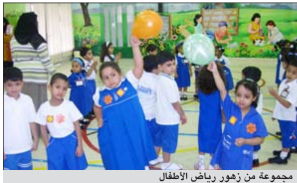
مجموعة من زهور رياض الأطفال

تبدأ صباح اليوم مدارس رياض الأطفال في استقبال كوكبة جديدة من أبنائنا الطلبة في يومهم الدراسي الأول، والذي سيبقي محفوراً في ذاكرة الكثير منهم طوال حياتهم، في حين تستعد مدارس المرحلة الابتدائية لاستقبال طلبة الصف الأول الابتدائي غداً الاثنين، في حين يلتحق بهم زملاؤهم في بقية الصفوف من الصف الثاني إلى الصف الخامس بعد غد الثلاثاء. بينما يبدأ دوام الطلبة في المرحلتين المتوسطة والثانوية يوم الأحد القادم الموافق 23 من الشهر الجاري، وذلك بعد ان تم تعديل القرار رقم 1 الخاص بتحديد مواعيد الاجازات والمواعيد للعام الدراسي في المدارس بتقديم موعد الدراسة