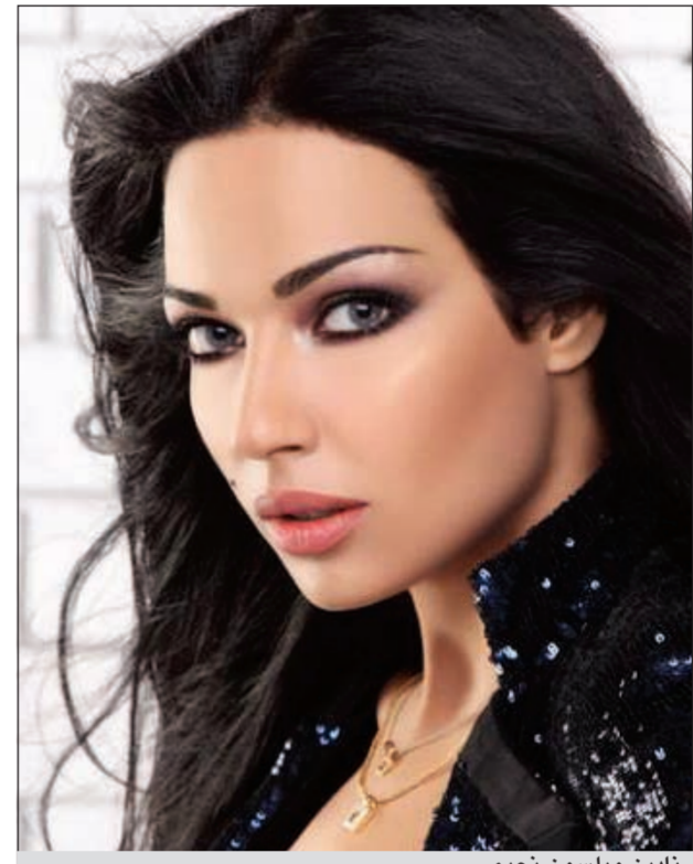
نادين ويلسون نجيم

تخوض ملكة جمال لبنان السابقة والممثلة نادين ويلسون نجيم تجربتها الأولى في عالم التقديم من خلال برنامج «The Voice» على شاشة «أم.بي.سي.»، «الأنباء» التقت ويلسون للتحدث عن تجربتها الأولى في عالم التقديم، وكان الحوار الآتي: