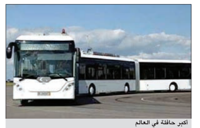
أكبر حافلة في العالم

بون: تم الكشف عن أكبر حافلة في العالم بالمانيا والتي يبلغ ثمنها 10 ملايين دولار، يبلغ طول هذه الحافلة 33 متراً تقريبا وتتسع لنحو 256 راكبا. تمت تجربة هذه الحافلة العملاقة في مدينة «درسدن» الألمانية ومن المتوقع أن تدخل نطاق الخدمة قريبا بعد أن تم حجز طلبات منها لمدينة «شنغهاي» الصينية. من جهة أخرى أحيل فرنسي إلى القضاء بتهمة إتلاف المال العام بعد أن قام بمساعدة بعض سكان مدينته الصغيرة بنقل محطة أتوبيس عام من مكانها لتفادي الإزعاج الذي تحدثه مجموعة من الشباب اعتادوا الجلوس على مقاعد المحطة الواقعة بالقرب من نافذة شقته. وذكرت مجلة «لوبوان» الفرنسية أن قاضي أتوبيس النقل العام بمدينة آرسي الفرنسية الصغيرة فوجئوا بأن محطة الأتوبيس التي اعتادوا التوقف عندها في احد الشوارع الضيقة يوسط المدينة انتقلت من مكانها لمسافة 50 كيلومترا من دون أن يخبرها أحد بذلك. وقد أسفرت تحريات الشرطة عن أن شخصا يقم بالعقار المواجه للمحطة ستم من الأزعاج الذي تحدثه مجموعة من الشباب المراهقين فقام بتحريض سكان العمارة على مساعدته على نقل المحطة من مكانها بعد أن قاموا بنشر قواعدا الحديدية بمنشار كهربائي. واعترف هذا الفرنسي الذي يبلغ من العمر 50 عاما بما قام به ميرا ذلك بأنه اضطر لنقل المحطة بعد أن يئس من قيام المسؤولين عن المدينة بهذه المهمة رغم الشكاوى المتعددة التي تقدم بها.