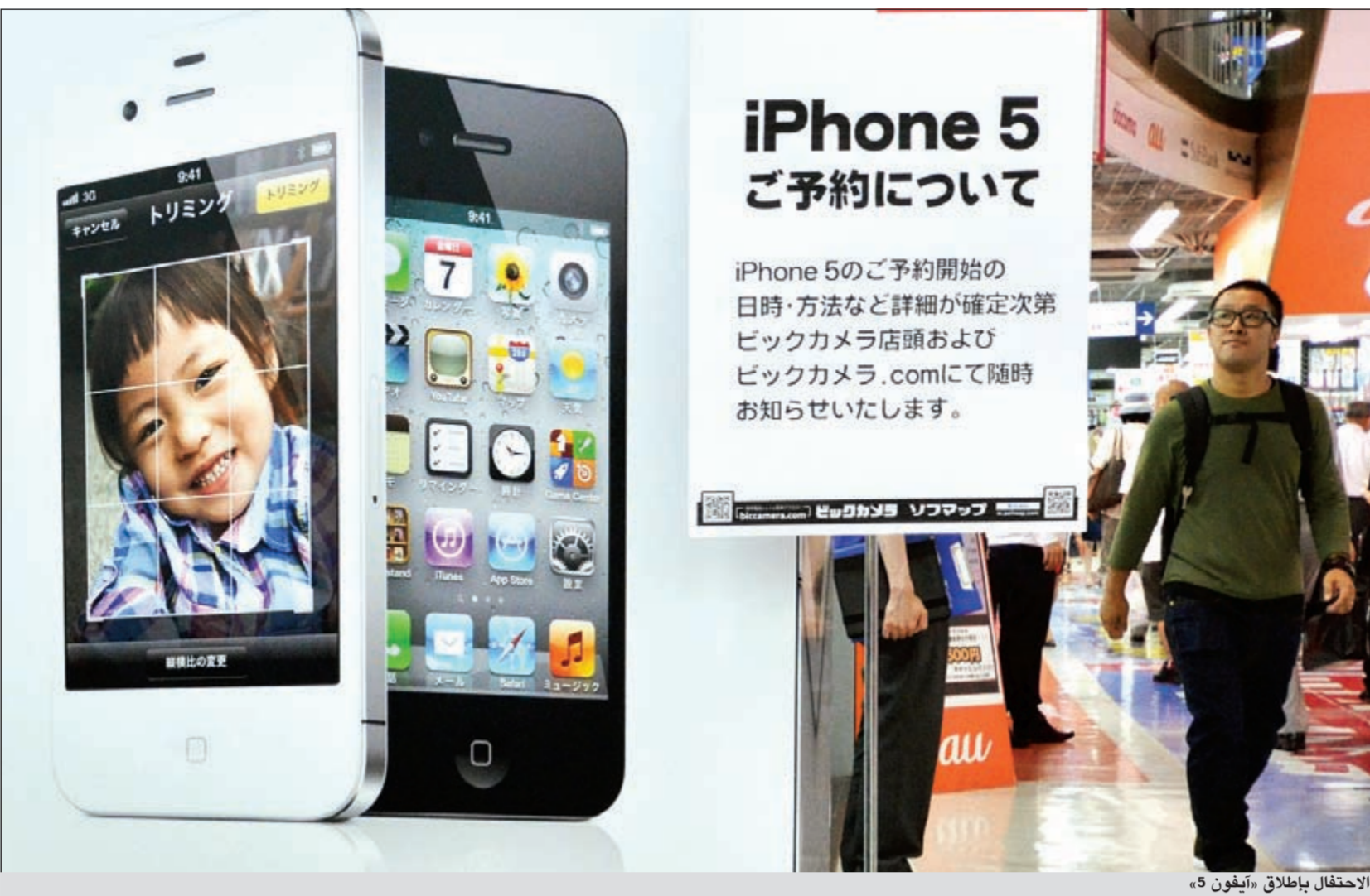
الاحتفال بإطلاق «آيفون 5»