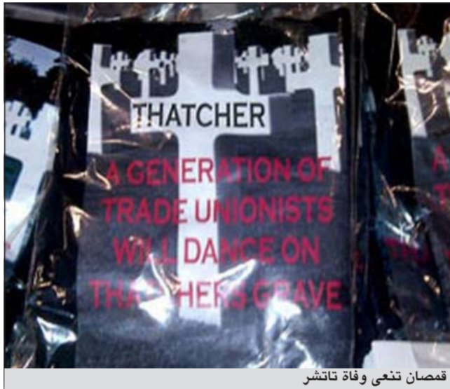
قمصان تنعى وفاة تاتشر

لندن - إيلاف: أجبرت انتقادات عنيفة «اتحاد نقابات العمال» في مؤتمره العام السنوي في مدينة بريستون الجنوبية على إزاحة قمصان «تي شيرت» تباع في أحد الأكتشاك المحيطة بقاعته، لأنها تحتوي بموت رئيسة الوزراء المحافظة السابقة مارغريت تاتشر، رغم انها حية ترزق الآن. أتت هذه الانتقادات من مختلف الجهات العمالية، وعلى رأسها زعيم حزب العمال نفسه، إيد ميلباندي، الذي قال ان مسلكا كهذا لا يليق بالعمال وبحزبهم، ذلك ان القمصان التي تباع بعشرة جنيهات للقطعة، وتحمل شعارات يفيد أجدها، مثلا، بان العمال البريطانيين «سيرقصون