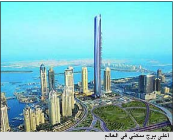
أعلى برج سكني في العالم

دبي - د.ب.أ: دشنت إمارة دبي أول من امس أعلى برج سكني في العالم بارتفاع 414 مترا. وقالت شركة «تعمير» المنفذة للمشروع، في مؤتمر صحفي بدبي امس، ان موسوعة غينيس للأرقام القياسية، ومجلس المباني الشاهقة والمساكن الحضرية، أقر بأن المبنى الذي يحمل اسم «برنس تاور» هو المبنى السكني الأطول في العالم.