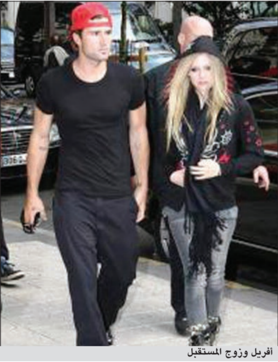
أفريل وزوج المستقبل

يوي.أي: يبدو أن المغنية الكندية أفريل لافين تزداد غرابة، فقد اعربت عن نيتها صنع فستان زفافها المقبل من أقمشة فساتين ممزقة. ونقل موقع «كونتاك ميوزيك» الأميركي عن لافين قولها: لدي فكرة عما أريده. وأضافت: اظن أنني سأشتري مجموعة مختلفة من فساتين الزفاف، وساقوم بتمزيقها ومن ثم سأجمع أجزاءها لأجعل منها فستاناً. وأشارت إلى أنها ربما تلجأ إلى أحد المصممين بهدف اتمام المهمة. واعربت لافين عن إعجابها بخاتمة خطوبتها الماسية معتبرة أنه يتناسب مع كل الأزياء التي ترتديها وقالت: لا أزيه من اصيبي على الإطلاق حتى عندما أريد النوم. وكانت لافين أعلنت خطوبتها في شهر أغسطس الماضي على نجم الروك الكندي تشاد كروغر. يشار إلى أن لافين (27 سنة) وكروغر (37 سنة) اجتمعا للمرة الأولى في فبراير الماضي لتأليف أغنية في ألبوم المغنية الخامس.