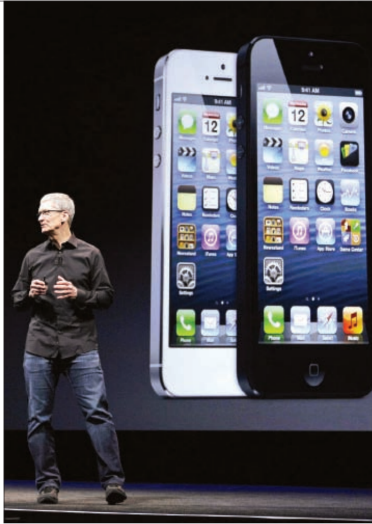
الرئيس التنفيذي لشركة آبل تيم كوك يقدم شرحاً حول هاتف آيفون 5