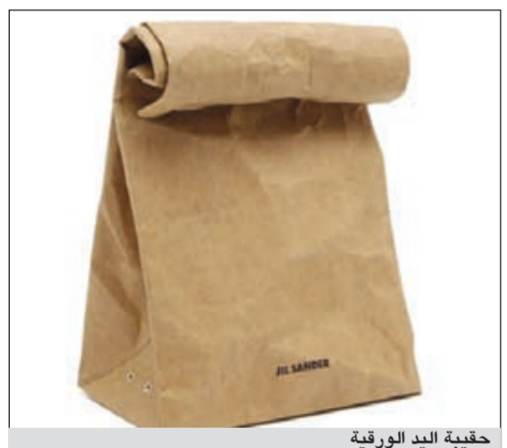
حقيبة اليد الورقية

طرحها للبيع، كما انها لم تعد متاحة على موقع المتجر الإلكتروني الرسمي الخاص بجبل ساندن، ويمكن للراغبين في شرائها اقتناء الاصدار صغير الحجم مقابل مبلغ يقدر بـ 175 استرلينياً.