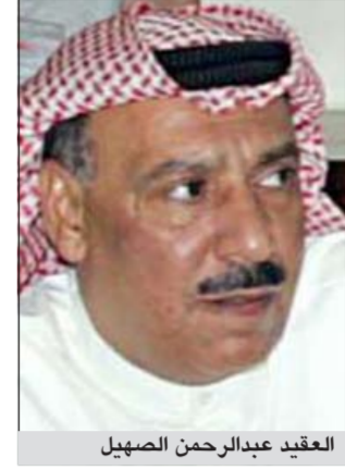
العقيد عبدالرحمن الصهيل أنهى رجال إدارة بحث وتحري محافظة حولي بقيادة العقيد عبدالرحمن الصهيل ومساعدته المقدم وليد الفاضل نشاط عصابة ثنائية استهدفت أكثر من 35 محل لبيع المجوهرات والهواتف الحديثة وقدرت المسروقات التي تمكن اللصان وهما امرأة منتقبة وشريك لها بنحو 30 ألف دينار.

استنادا الى مصدر أمني فان معلومات وردت الى مدير مباحث حولي العقيد عبدالرحمن الصهيل تضمنت ان وراء قضايا السرقات التي تستهدف محلات الصاغة والهواتف الذكية بأسلوب «المغافلة» سيدة وشخص من ارباب السوابق. وقال المصدر: قام العقيد عبدالرحمن الصهيل بالإبلاغ الى مساعده المقدم الفاضل بنتدع هذه التحريات حيث قام الفاضل بعمل مراقبة على السيدة وارباب السوابق بهدف