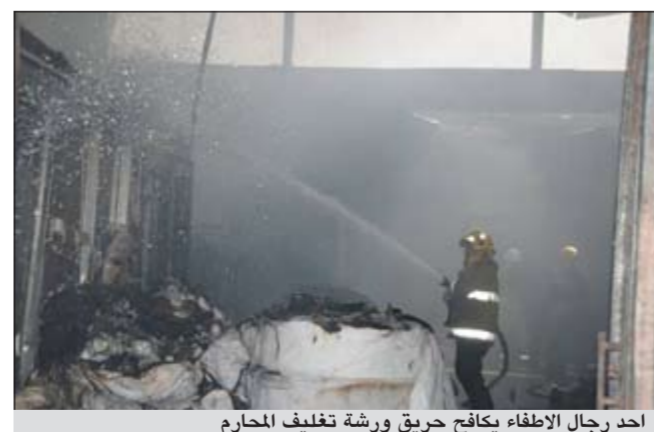
احد رجال الاطفاء يكافح حريق ورشة تغليف محارم