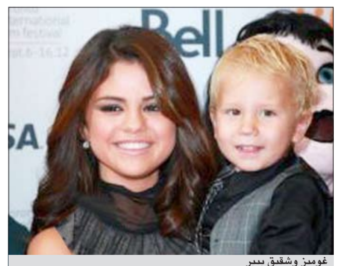
غوميز وشقيق بيبير

حضرت النجمة سيلينا غوميز وأدم ساندلر العرض الخاص لفيلمها Hotel Transylvania في مهرجان تورنتو السينمائي لعام 2012. واصطحبت سيلينا معها جيسون شقيق حبيبها جاستين بيبير والنقلت سيلينا عدداً كبيراً من الصور برفقة جيسون وإبطال عمل الفيلم.