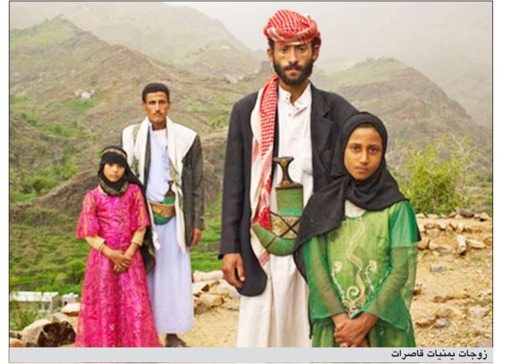
زوجات يمنيات قاصرات

صنعاء - العربية: أقرت اللجنة التحضيرية لمؤتمر الحوار الوطني المرتقب في اليمن إدراج قضية زواج الصغيرات ضمن مشروع برنامج عمل المؤتمر كأهم القضايا الاجتماعية ذات الأولوية التي تؤثر على مستقبل الطفولة بجانب تهريب وعمالة وتجنيد الأطفال. ووفقاً لتقارير رسمية توجد 8 حالات وفاة يومياً في اليمن بسبب زواج الصغيرات والحمل المبكر والولادة في ظل غياب المتطلبات الصحية اللازمة. وبحسب تقرير أصدره المركز الدولي لدراسات العام الماضي، فقد حلت اليمن في المرتبة الـ 13 من بين 20 دولة صنفت على أنها الأسوأ في زواج القاصرات، حيث تصل نسبة الفتيات اللواتي يتزوجن دون سن الثامنة عشرة إلى 4.48٪. وكانت اللجنة الفنية التحضيرية لمؤتمر الحوار الوطني الذي نصت عليه المبادرة الخليجية قد شهدت جدلاً واسعاً بشأن موضوع زواج