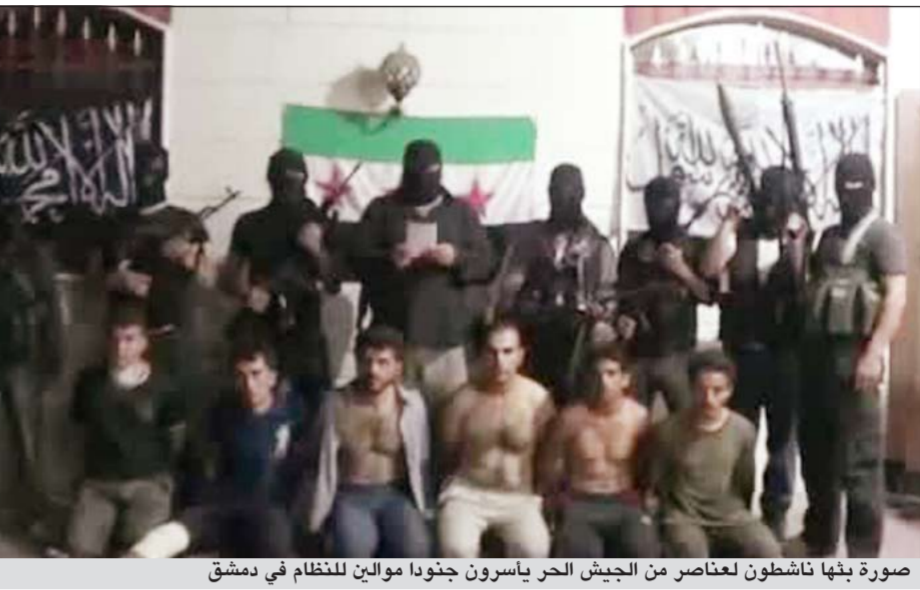
صورة بنها ناشطون لعناصر من الجيش الحر ياسرون جنودا موالين للنظام في دمشق

ورأى 74٪ أن وجود اللاجئين السوريين خارج المخيمات المخصصة لهم يهدد أمن واستقرار البلاد. ووفقا لاستطلاع، يوافق حوالي 80٪ من المشاركين على استضافة اللاجئين داخل مخيمات مغلقة وهو ما يؤيده 86٪ من الساسة والمسؤولين في الأردن. ويقول مسؤولون إن عمان تشعر بالقلق من تأثير اللاجئين المشردين على استقرار الأردن في أعقاب سلسلة من أعمال الشغب التي اندلعت في مخيم الإيواء الوحيد في البلاد. ويأتي هذا الاستطلاع وسط جدل عام متزايد في الأردن بشأن قدرة البلاد على مواصلة استضافة اللاجئين السوريين، حيث تشير التوقعات إلى أن الحكومة تحتاج إلى ما بين 400 مليون دولار و700 مليون دولار خلال الأشهر الستة المقبلة. وحذرت عمان من أنها قد تعيد النظر في سياسة الحدود المغلقة مع سورية في حال رفض المجتمع