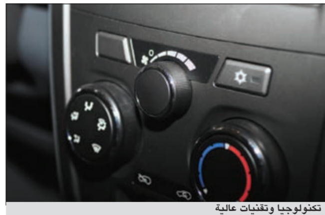
تكنولوجيا وتقنيات عالية