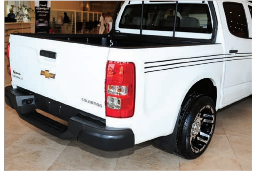
السيارة من الخلف