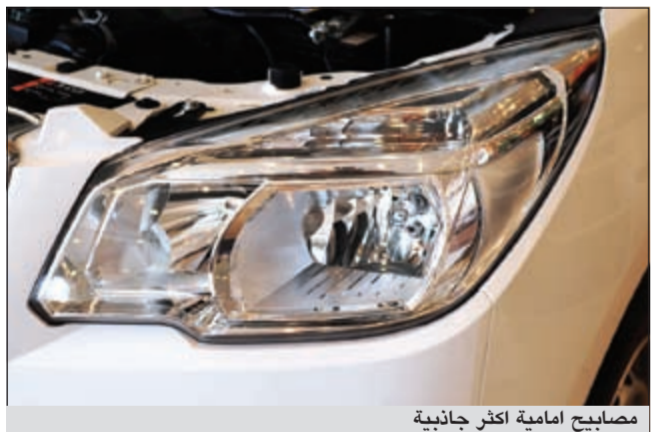
مصابيح أمامية أكثر جاذبية

وقال: إن كولورادو الجديدة كلياً تأتي بمحركين متفوقين يعملان على الوقود، المحرك الأول يأتي 2,4 ليتر لأربعة