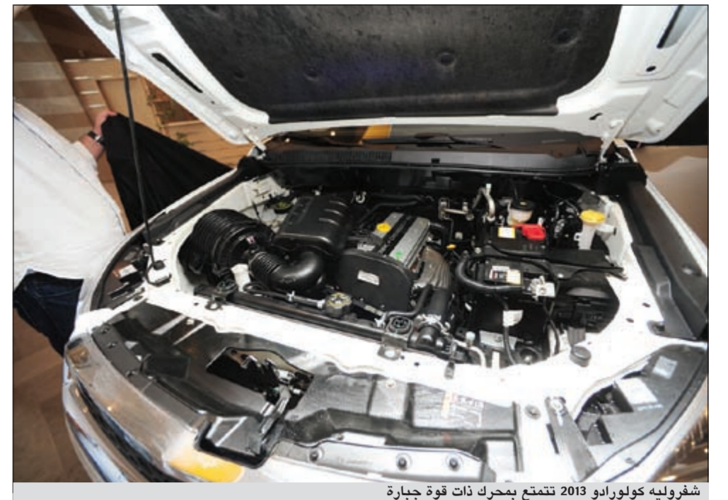
شفروليه كولورادو 2013 تتمتع بمحرك ذات قوة جبارة