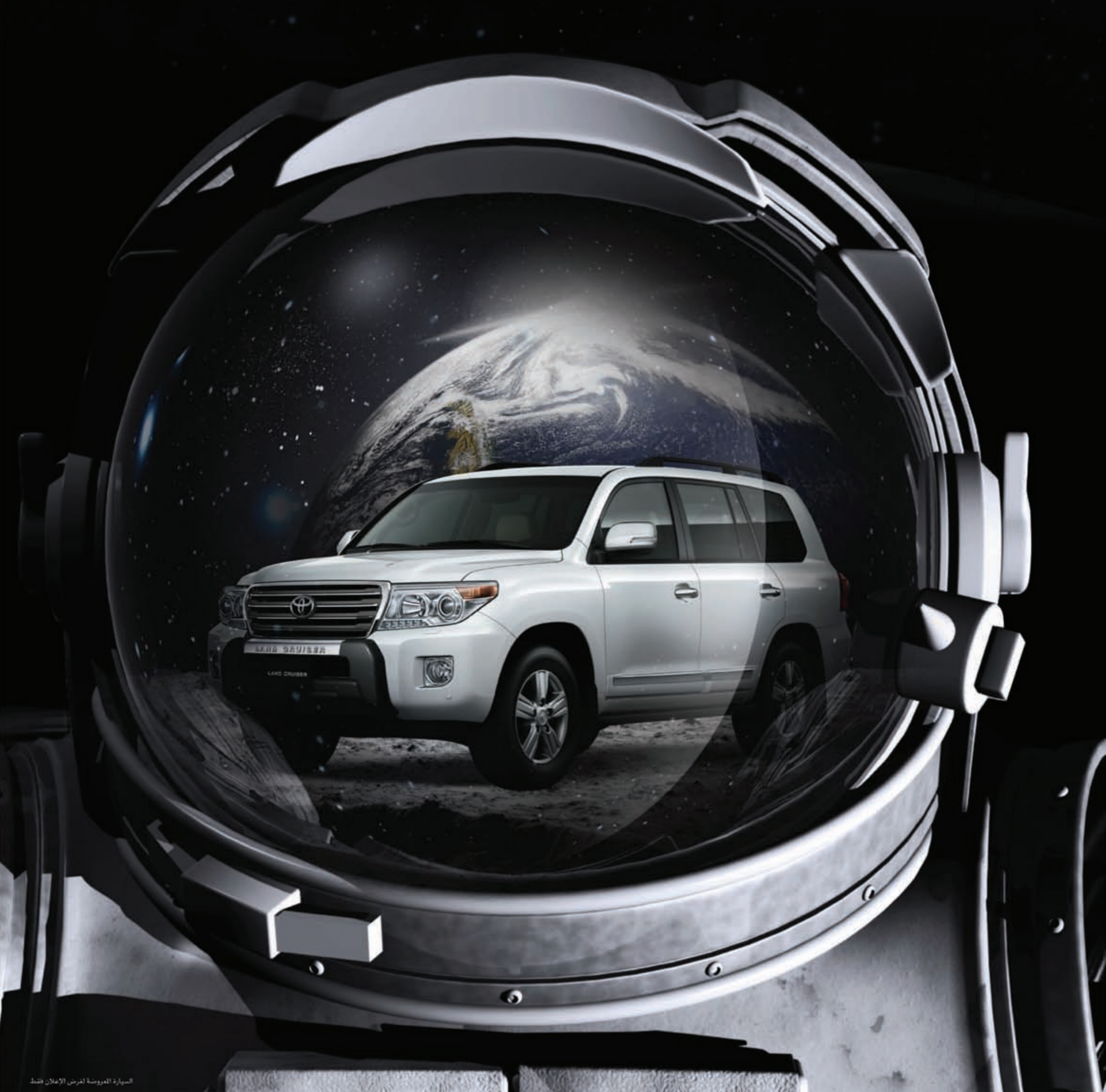
السيارة المفروسة لعرض الإعلان فقط

ترعب على القمة عند قيادتك لاند كروزر مفخرة الأرض بلا منازع، قوة تحكم وثبات استثنائية تتحدى أقسى الطرقات. غني بعناصر التميز، الرفاهية والتكنولوجيا الأحدث على الإطلاق ضمن مقصورة فسيحة ومريحة. يأتي الآن بأقل زاوية انعطاف بفئته لقيادة أكثر سلاسة. بالإضافة إلى الدعم وخدمة ما بعد البيع لدى مجموعة السايير. تفضل بزيارة أي من معارضنا اليوم للتعرف على تويوتا لاند كروزر وتجربة قيادته.