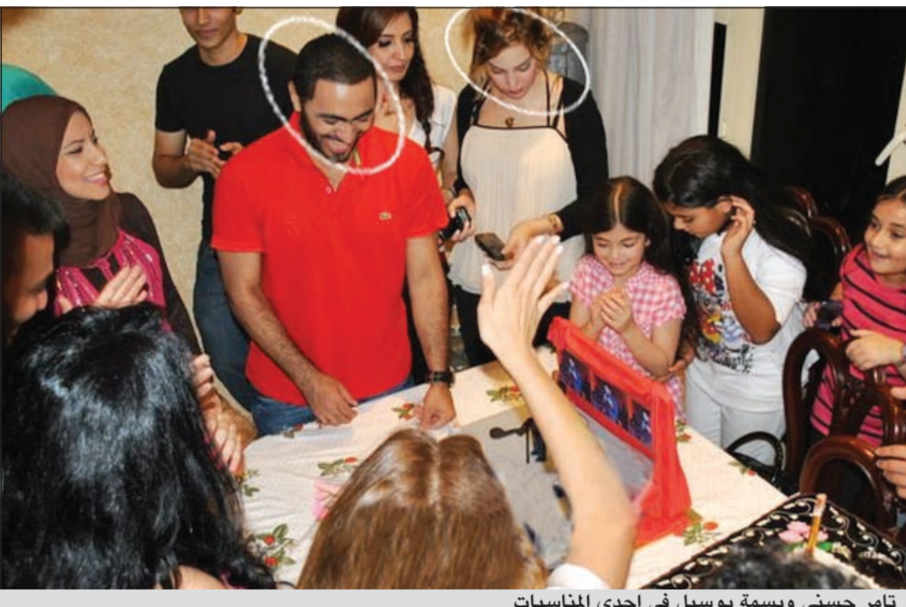
تامر حسني وبسمة بوسيل في إحدى المناسبات

بالصور التالية لتأكيدهم على تلك العلاقة التي انتهت بالزواج.