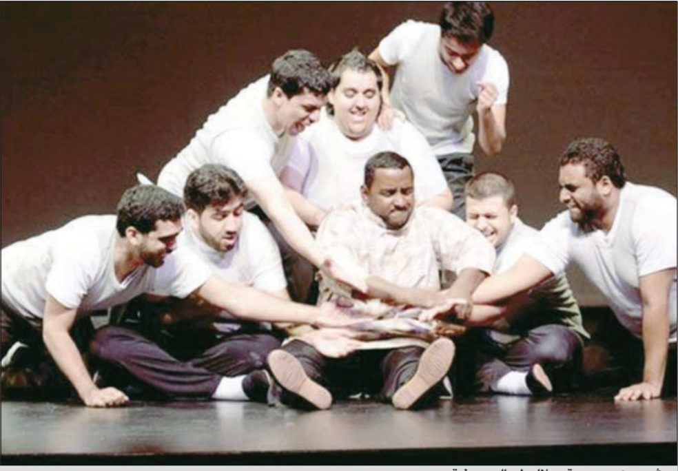
مشهد من مسرحية «بلاليط» البحرينية