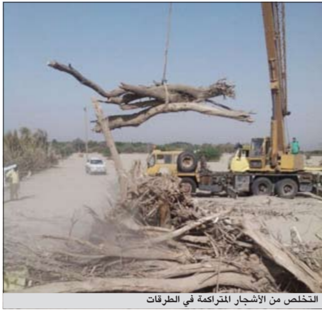
التخلص من الأشجار المتراكمة في الطرقات