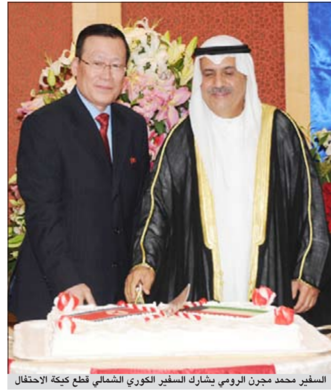
السفير محمد مجرن الرومي يشترك مع السفير الكوري الشمالي في قطع كعكة الاحتفال

جدد مدير إدارة آسيا في وزارة الخارجية السفير محمد مجرن الرومي القلق الكوري تجاه برنامج إيران النووي ومفاعل بوشهر، مشيراً إلى أن الكويت دائماً تطلب من إيران التي تربطنا بها علاقات جيدة أن تتعاون مع الوكالة الدولية للطاقة الذرية وأن تحترم جميع القرارات الصادرة عن مجلس الأمن وأن تكون مباحثاتها مع مجموعة الـ (1+5) حول البرنامج النووي مباحثات مجددة لتجنب هذه المنطقة كثيراً من الويلات والحروب».