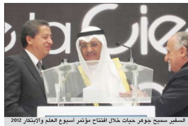
السفير سميج جواهر حيات خلال افتتاح مؤتمر أسبوع العلم والابتكار 2012

وتطرق حيات في محاضراته إلى العلاقات الكويتية - المكسيكية والجهود التي تقوم بها قيادات البلدين في تطوير وترسيخ العلاقات وسبل التعاون في جميع المجالات بما فيها العلمية والثقافية.