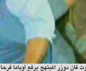
مالك مطعم البيترزا سكوت فان دوزر المتهجج يرفع أوباما فرحا بدخوله مطعمه

عواصم - وكالات: حقق الرئيس الأميركي براك أوباما تقدماً على منافسه في انتخابات الرئاسة ميت رومني، سواء في استطلاعات الرأي أو في حجم تبرعات الحملة الانتخابية، بلغ في أغسطس الماضي 114 مليون دولار. وفي المقابل بلغ حجم التبرعات التي جمعها الجمهوري رومني حتى الشهر الماضي 111 مليون دولار. ووفقاً لبيانات أوباما، اكتسبت حملته الانتخابية 317954 مؤيداً إضافياً الشهر الماضي، بمتوسط تبرعات 31 58 دولاراً للفرد الواحد.