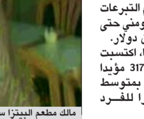
مالك مطعم البيترزا سكوت فان دوزر المتهجج يرفع أوباما فرحا بدخوله مطعمه

عواصم - وكالات: حقق الرئيس الأميركي براك أوباما تقدماً على منافسه في انتخابات الرئاسة ميت رومني، سواء في استطلاعات الرأي أو في حجم تبرعات الحملة الانتخابية، بلغ في أغسطس الماضي 114 مليون دولار. وفي المقابل بلغ حجم التبرعات التي جمعها الجمهوري رومني حتى الشهر الماضي 111 مليون دولار. ووفقاً لبيانات أوباما، اكتسبت حملته الانتخابية 317954 مؤيداً إضافياً الشهر الماضي، بمتوسط تبرعات 31 58 دولاراً للفرد الواحد.