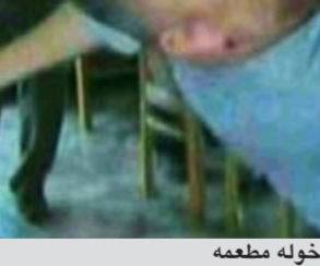
مالك مطعم البيترزا سكوت فان دوزر المتهجج يرفع أوباما فرحا بدخوله مطعمه

عواصم - وكالات: حقق الرئيس الأميركي براك أوباما تقدماً على منافسه في انتخابات الرئاسة ميت رومني، سواء في استطلاعات الرأي أو في حجم تبرعات الحملة الانتخابية، بلغ في أغسطس الماضي 114 مليون دولار. وفي المقابل بلغ حجم التبرعات التي جمعها الجمهوري رومني حتى الشهر الماضي 111 مليون دولار. ووفقاً لبيانات أوباما، اكتسبت حملته الانتخابية 317954 مؤيداً إضافياً الشهر الماضي، بمتوسط تبرعات 31 58 دولاراً للفرد الواحد.