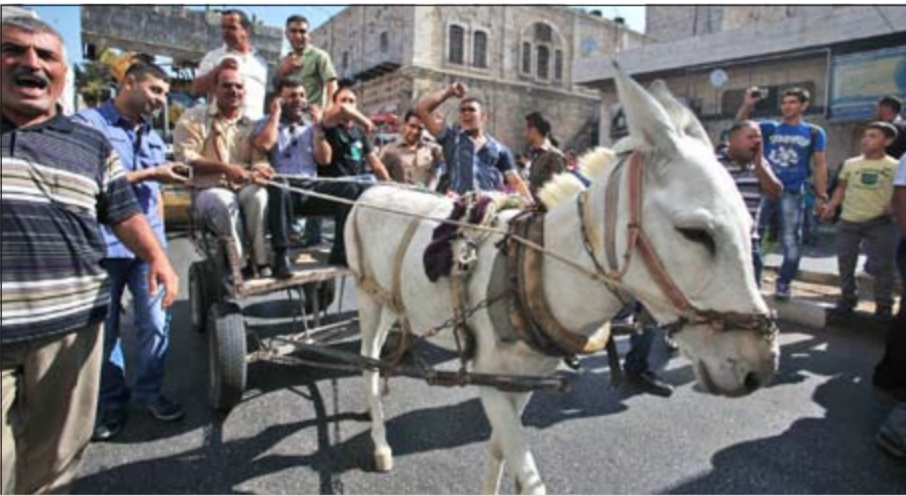
فلسطينيون مضربون يستخدمون الحمبر للتحلل احتجاجا على غلاء الاسعار (أ.ف.ب)

الإسرائيلية في القدس، وأضافت أنه جرى استثمار هذه الحفلات لسرد الرواية «التلمودية» للقدس والدعاية للأفكار الصهيونية والإنجيلي صهيونية، للسياح الأجانب والمستجلبين الجدد والمستوطنين ضمن خطط تغيير الطابع الحضاري الإسلامي العربي للمدينة المقدسة، في سياق متصل، سلمت سلطات الاحتلال الإسرائيلي ست عائلات فلسطينية أوامر بهدم منازلهم في مدينة القدس المحتلة، وقالت مصادر فلسطينية إن سلطات الاحتلال أبلغت عائلات في سلوان بالقدس المحتلة بهدم منازلهم التي بنيت بعد العام 1992.