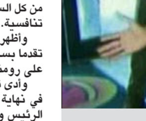
مالك مطعم البيترزا سكوت فان دوزر المتهجج يرفع أوباما فرحا بدخوله مطعمه

عواصم - وكالات: وصف طارق الهاشمي نائب الرئيس العراقي المتواجد في تركيا حكم الإعدام الصادر بحقه غيابياً بأنه «جائر»، وقال إن محاكمته «صورية»، وأنه لن يترك تركيا ويعود إلى العراق في غضون 30 يوماً كما هو مطلوب منه. وقال الهاشمي في مؤتمر صحفي بأنقرة إن رئيس الوزراء العراقي نوري المالكي والقضاء استكملا المرحلة النهائية من هذه المحاكمة التي وصفها بأنها مهزلة. وأضاف الهاشمي تأكيد براءته هو وحراسه بشكل كامل وقال إنه يرفض الحكم تماماً ولن يعترف به أبداً ووصفه بالجائر ووصف القضاء بأنه «مسييس».