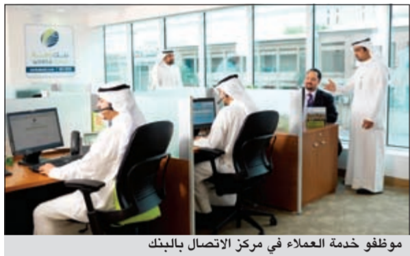
موظفو خدمة العملاء في مركز الاتصال بالبنك

وأضاف قائلاً: «يرتكز منهجنا في العمل على فهم احتياجات المتغير لدى شرائح عملائنا المختلفة، إذ إن البنك يوفر خبراء متخصصين في مجال خدمة العملاء يقومون على تلبية احتياجات العملاء بسرية تامة، كما أن دور الخدمة يضيف إلى بناء جسور الثقة بين البنك والعميل عن طريق تقديم أعلى جودة متمثلة في الخدمة السريعة والمنتجات المتغيرة». وأشار إلى أن جميع مسؤولي خدمة العملاء في مركز الاتصال مديرون تدريباً جيداً، إذ أنهم حاصلون على الشهادة الدولية للبرامج المتخصصة في مجال مركز الاتصال من شركة «CarizMa» المعتمدة من شريكها الاستراتيجي في الولايات المتحدة الأمريكية USA Call Center School Center وبالتالي يطبق مركز الاتصال في بنك وربة أعلى معايير الجودة العالية من حيث سرعة الاستجابة لاصلاات العملاء وتلبية احتياجاتهم المختلفة».