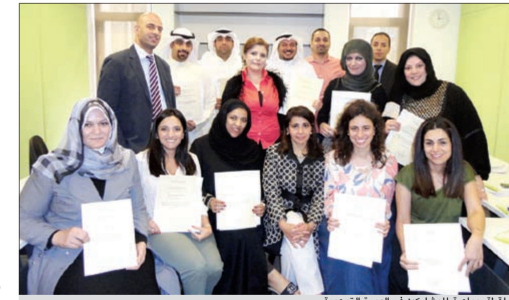
لقطة جماعية للمشاركين في الدورة التوعوية

وتتميز الريتل أكاديمي بقاعة المحاكاة التي تساعد المدربين على القيام بالتدريب الفعال وتمكينهم من مزاولة عملهم بكل ثقة ونجاح حيث يقوم المدربون بالتطبيق العملي في بيئة عمل واقعية وذلك بإشراف مرربي الأكاديمية. كما تضم الأكاديمية 16 قاعة تدريبية ومختبرات الحاسب الآلي، والصغيرة، وبالإضافة لذلك تعمل الريتل أكاديمي على تعزيز المستوى المهني بقطاع البيع بالتجزئة عن طريق التدريب النظري والتطبيقي في البيع والبحث عن الوظائف المحتملة بقطاع البيع بالتجزئة في دولة الكويت ومن ثم تكوّن الشباب من السعي للمهنة في هذا المجال.