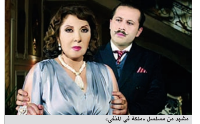
مشهد من مسلسل «ملكة في المنفى»