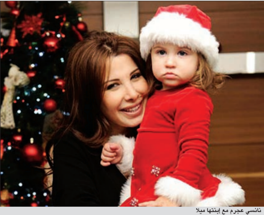
نانسي عجرم مع ابنتها ميلا

وتركت نانسي بحسب موقع «جولولي»، مدير أعمالها يجلس مع الشعراء والمحلين لاختيار بعض أغنيات الألبوم، وعادت لبيروت مهرولة بعد أن شعرت بالقلق الشديد على ابنتها.