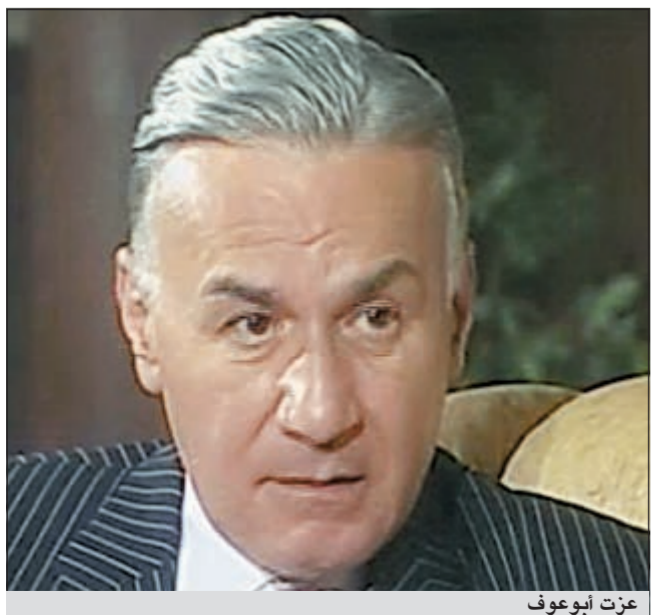
عزت أبو عوف