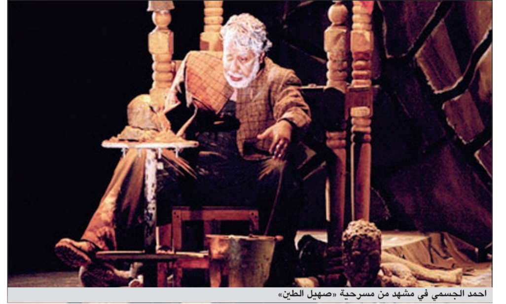
احمد الجسمي في مشهد من مسرحية «صهيل الطين»