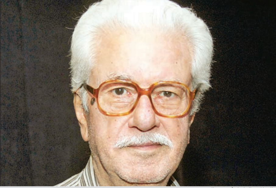
الاعلامي الراحل أحمد سالم