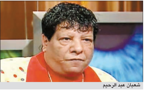
شعبان عبد الرحيم

يستعد الفنان الشعبي شعبان عبد الرحيم لتسجيل أغنية جديدة تحمل عنوان «كله يصقف»، وذلك الأسبوع القادم، وكتب الأغنية الشاعر إسلام خليل، وتسخر «كله يصقف» مما يحدث على الساحة السياسية كما أنها ترصد واقع وسلبيات الشارع المصري، بحسب ما صرح إسلام خليل لوسائل إعلام مصرية. وتقول كلمات الأغنية: طويل العمر.. يطول عمره.. يزهره عصره.. ويفرح بيه.. وكله يصقف.. مبروك علي مصر الحرية.. فرح يا أخويا أنت وهيا.. وكله يصقف.. بقيت الحياة مية مية..