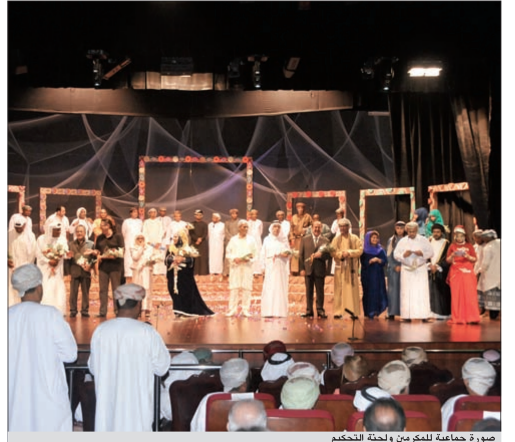
صورة جماعية للمكرمين ولجنة التحكيم

تضمن عرض أوبريت «دانة الخليج» وتكريم عدد من المسرحيين