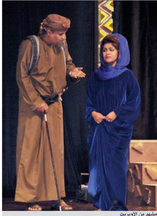
مشهد من الأوبريت