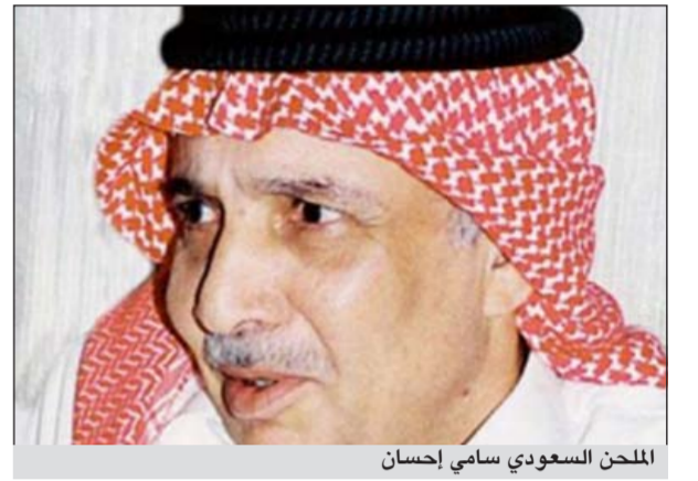
الملحن السعودي سامي إحسان

الرياض - ب.ب.ب. أي: توفي صباح أمس السبت الملحن السعودي سامي إحسان وصلي عليه عامر في مسجد الفيصلية بجدة غرب المملكة. وقدم إحسان عددا من الفنانين