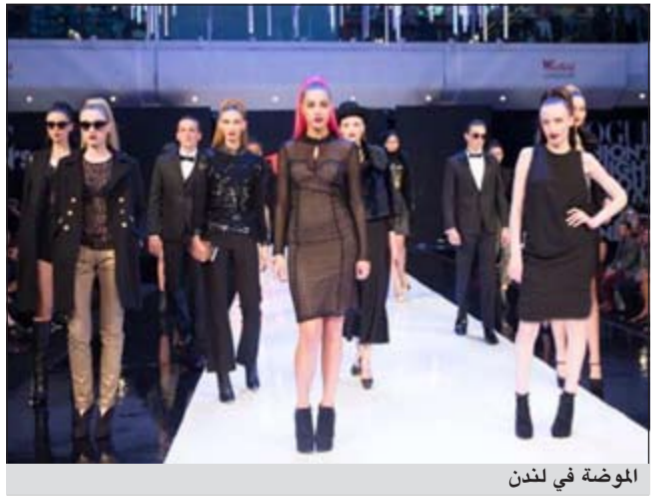
الموضة في لندن

واختيرت ساو باولو في البرازيل ملكة الموضة اللاتينية وجاءت في المركز السابع على مستوى العالم في حين هيبت هونغ كونغ ستة مراكز من العام الماضي لتصبح في المركز الثاني عشر هذا العام وهي عاصمة الأزياء في آسيا.