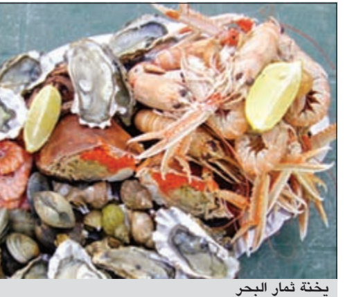
يخنة ثمار البحر

وأفادت صحيفة «ذي ريبابليكان» الأميركية ان فريق طهاة من كلية «أمهيرست» بالجامعة طبخوا اليخنة التي تزن 2949 كيلو غراما وتتضمن 453 كيلو غراما من ثمار البحر وحوالي 515 كيلو غراما بطاطا 250 كيلوغراما من البصل وحققوا الرقم القياسي. ووزعت اليخنة على الطلاب في أول أيام الدراسة وسوق يتم إدراج الإنجاز في موسوعة غينيس للأرقام القياسية.