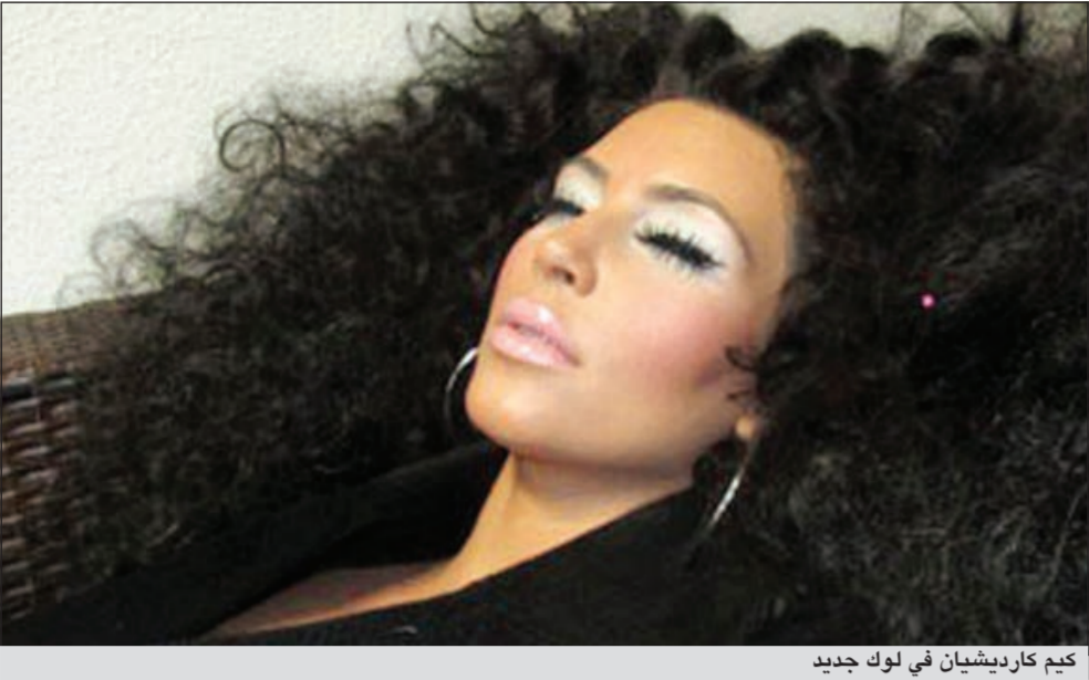
كيم كارديشيان في لوك جديد