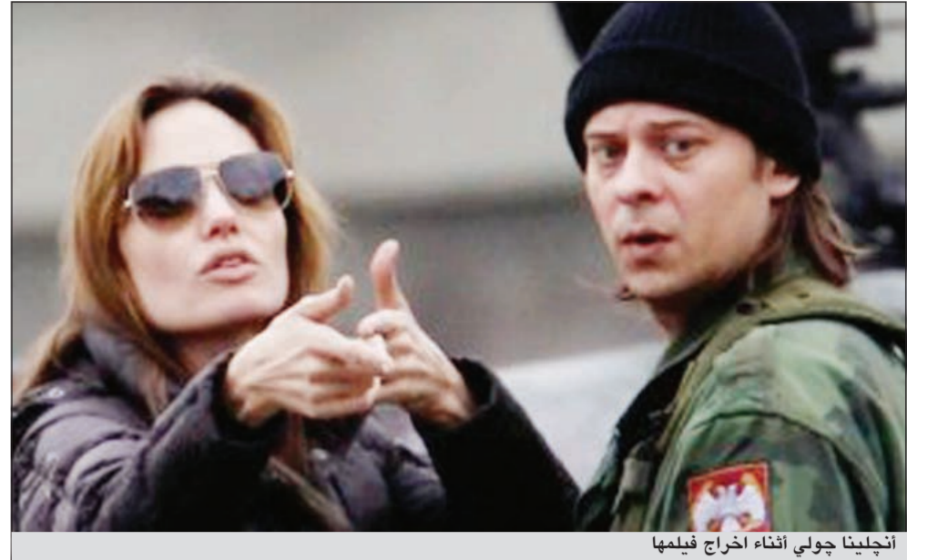
أنجلينا جولي أثناء اخراج فيلمها

كما اشارت الدراسة الى ان البريطانيين يحتفظن بملابس المراهقة التي تكشف عن معظم اجسادهم لمرحلة خريف العمر، رغم معرفتهن بحقيقة انها لم تعد صالحة لصغر مقاساتها، وفقا لصحيفة «الاتحاد» الاماراتية. وبحسب الدراسة فإن النساء البريطانيات من هذه الفئة العمرية يستلهمن الثقة من ثيمات هوليوود، مثل جينيفر أنيستون وهالي بيري، اللاتي يظهرن أكبر قدر من مفانن أجسادهن رغم تجاوزهن سن الـ 40.