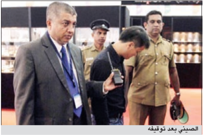
الصيني بعد توقيفه

من توقيف الرجل الذي ابتلع الماسة. وقد نقل المشتبه به إلى المستشفى حيث وصف له الأطباء مسهلات كي تخرج الماسة من أمعائه بطريقة طبيعية، لكن الصورة الشعاعية أظهرت أن الماسة عالقة في مريئه وأنه