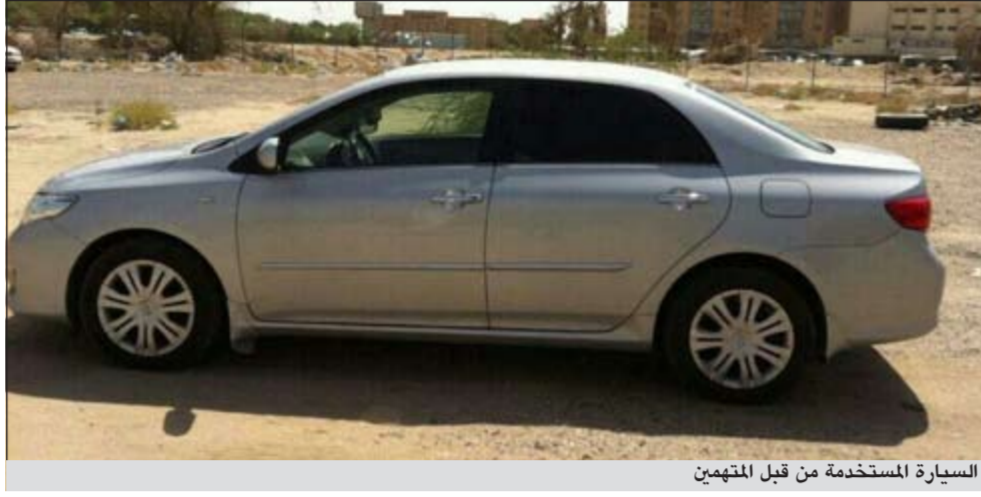
السيارة المستخدمة من قبل المتهمين

وَضُرَّ الأخرين. وما يسببه ذلك من تعرضهم للإجراءات والنصوص القانونية ومن مغبة طائلة القانون وعدم استعمالها بجميع أنواعها الا في الأماكن المسموح بها وفقا للتعليمات حفاظا على أرواحهم والأخرين.