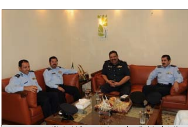
..والواء فهد الشرفاوي في حديث باسم مع قيادات الإطفاء

وتهيب إدارة الإعلام الأمني بالمواطنين والمقيمين بضرورة متابعة أولياء الأمور لأبنائهم ومنعهم من هذه التصرفات الطائشة وغير المسؤولة والتي تسبب إيذاء