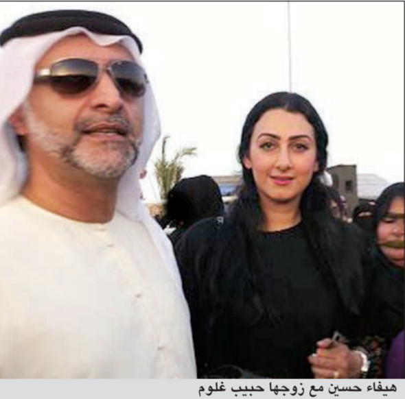
هيفاء حسين مع زوجها حبيب غلوم

وكالات: يبدو ان انشغال هيفاء حسين بأعمالها في العيد أبعدتها عن بيتها وزوجها الفنان حبيب غلوم، مما دفعه الى التعبير عن ذلك للمرة الأولى عبر «تويتر»، إذ كتب على حسابه: «صباح الخير فنانتنا الغالية، شو اخبارك إن شاء الله بخير؟ واشتقتنا وايد» في إشارة الى أنها أطلقت الغياب، وهنا ردت هيفاء عليه عبر «تويتر»، ايضاً «صباح الشوق يا الحب يا فنان الإمارات والخليج»، أثارته هذه التغريدات استغراب كثيرين لم يعتقدوا رؤية الزوجين يعبران عن مشاعرهما علناً. وقد تعددت التحليلات لتصرحات الزوجين، فممن من اعتبرها عتبا غير مباشر بوجهه الفنان الذي زوجته الممثلة البحرينية، ومنهم من رأى ان مشاعرهما لم تستوعبها جدران المنزل، فطلعت الى سطح «تويتر»! أحد المتابعين للفنانين لم يكتف بالتحليل، بل نقل استغرابه اليهما عبر تويتر، فردد عليه غلوم: «المحب