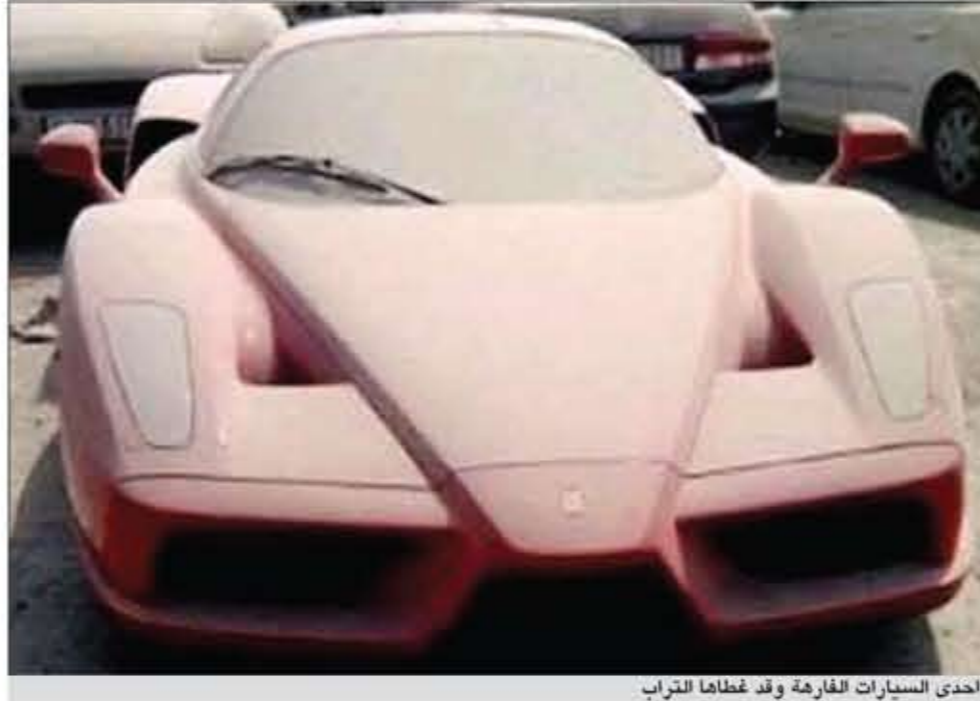
أحدى السيارات الفارغة وقد غطها التراب

جنه إسترليني و1,5 مليون. وقالت الصحفية: لقد ترك الأجانب حوالي 3 آلاف سيارة الأجنبيات التي تصنعها عملاق شركات التكنولوجيا، شركة آبل، وخصوصاً خلال النصف الأول من العام الحالي. وأشارت الدراسة إلى أن شركة آبل التي أعلنت في وقت سابق أن أجهزة تها لا يمكن اختراقها من قبل الفيروسات، شهدت هجوماً عنيفاً من قبل فيروس يسمى «فلاش باك» الذي تمكن من اختراق مئات الآلاف من أجهزة آبل وخصوصاً من نوع «ماكنتوش».