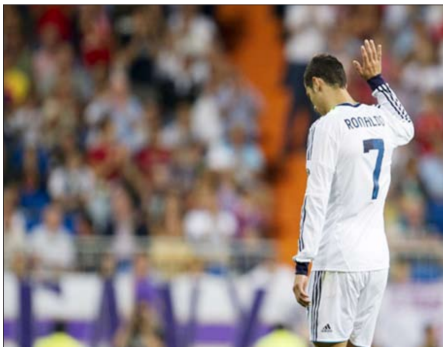
كريستيانو رونالدو ينفى أن المال سبب في مشكلته مع إدارة فريقه

يقضى نصف ما يحصل عليه نجم برشلونة وانتر ميلان الإيطالي السابق الكامبروني صامويل إيتو في أنجي ماخاشسكال، مضيفة «أن الراتب الذي يتقاضاه هو من الأسباب التي تزج اللاعب». لكن رونالدو نفى هذه التكهنات في صفحته على موقع «فيسبوك» وفي مدونته على موقع «تويتر»، قائلا «أن شعوري بالحزن والكتابة تسبب في ضجة كبيرة. اتهموني بأنني أريد المزيد من الأموال، لكن في يوم من الأيام سيعلمون أنه ليس السبب». وأكد رونالدو لجمهري ريال مدريد أن «اندفاعه، تفانيه، التزامه ورغبته في الفوز بجميع البطولات، لن تتأثر، مضيفا «أنا أحترم نفسي وريال مدريد لدرجة لا تسمح لي إطلاقا بأن أقدم أداء يقل عما أنا قادر عليه»، موحيا تحياته ومحبة لجمهري النادي الملكي.