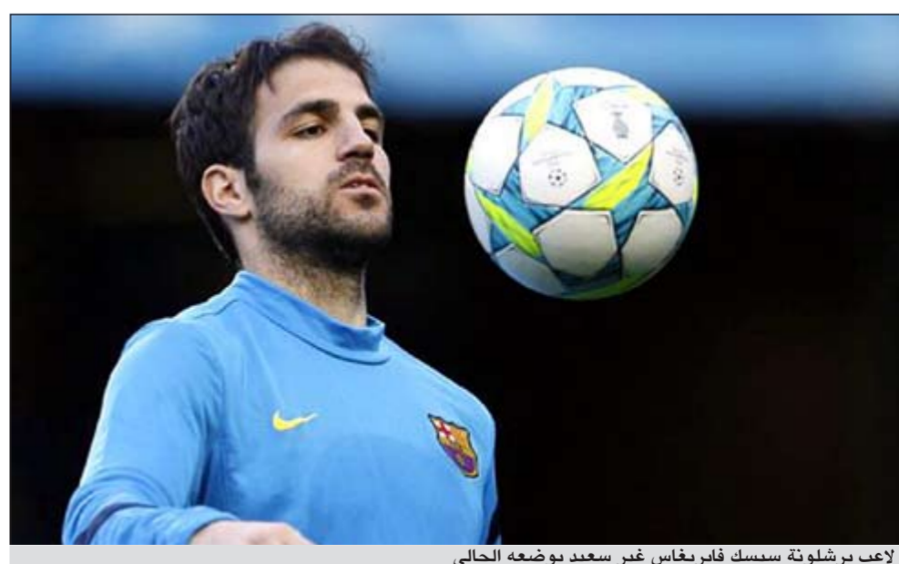
لاعب برشلونة سيسك فابريغاس غير سعيد بوضعه الحالي

وكان ابيدال أعلن في 24 أغسطس الماضي عبر صفحته على موقع «فيسبوك» للتواصل الاجتماعي أنه عاد منذ فترة وجيزة للتمارين البدنية، كما ذكر في مقابلة تلفزيونية انه بأصل العودة إلى اللعب قبل ديسمبر. وفي مقابلة مع قناة «تي في 3»، الكاتالونية، قال ابيدال «لنر اذا ما كان في امكاني اللعب مع برشلونة قبل ديسمبر المقبل»، مشيرا الى ان العودة قبل الشهر المذكور «هي الهدف»، مشددا على ان تأجيلها الى ما بعد ذلك «لن يكون سيئا، المهم ان أعود».