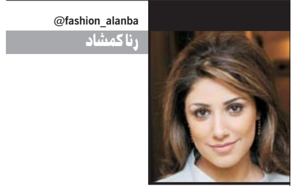
@fashion_alanba رنا كمشاد

وشيناً فشيئاً، زاد الإقبال وارتفعت أرباح الشركة لتصل قيمتها السوقية إلى أكثر من 4 مليارات دولار في أقل من 10 سنوات، واشترت غوتشي حينها حصة في دار «إيف سان لوران» الفرنسية وعين توم فورد أيضاً مسؤولاً عنها، وكما ارتفعت أسهم غوتشي في الأسواق المالية ارتفعت معها أسهم مصممها.