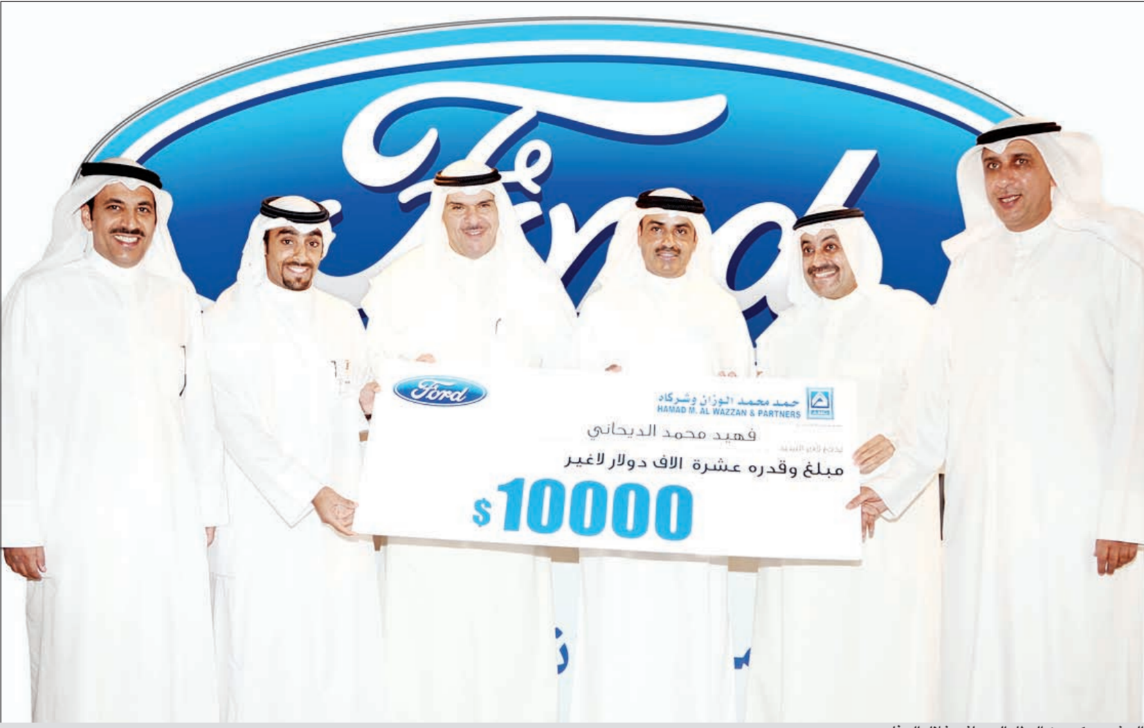
الحضور يكرمون البطل الديحاني خلال الحفل