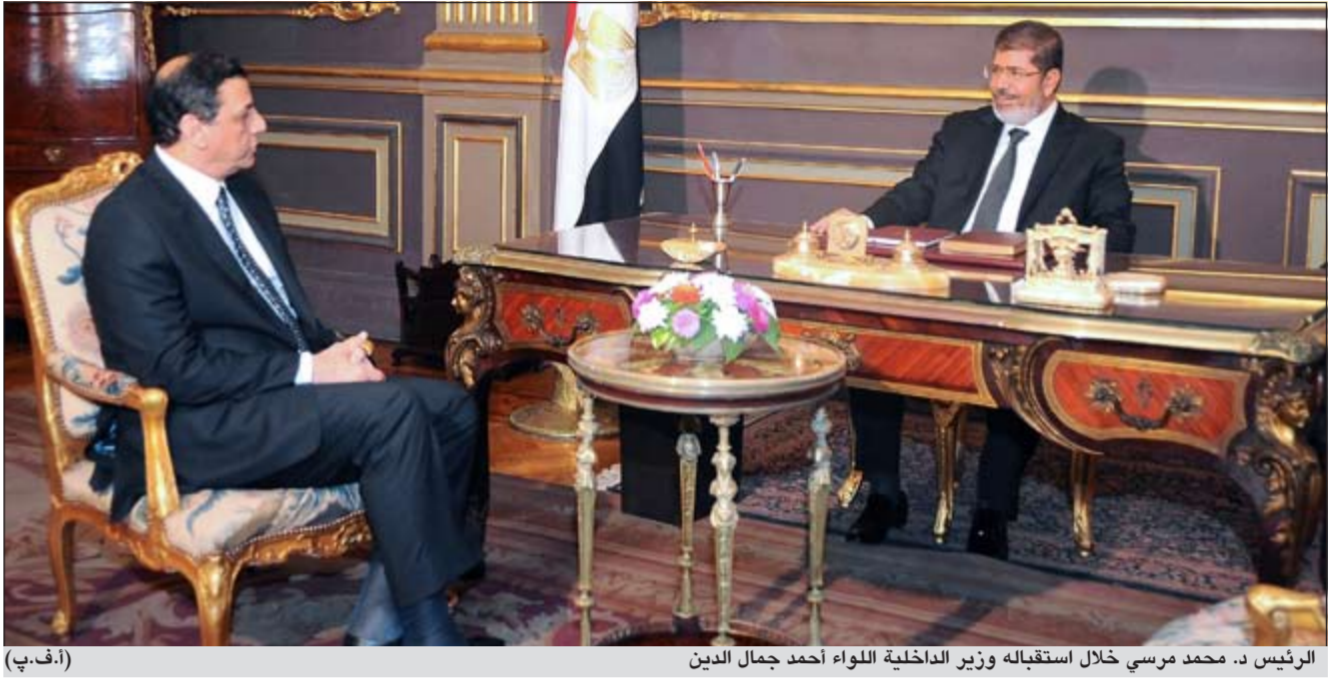
الرئيس د. محمد مرسي خلال استقباله وزير الداخلية اللواء أحمد جمال الدين

عواصم - وكالات: أصدر الرئيس د. محمد مرسي أمس قراراً جمهورياً بتعيين 10 محافظين جدد هم: وعين مرسي أسامة كمال محافظاً للقاهرة، واللواء سيد عبدالفتاح حرحور محافظاً لشمال سيناء، وم. سعد الحسيني محافظاً لكفر الشيخ، ومحمد عطا عباس محافظاً للإسكندرية.