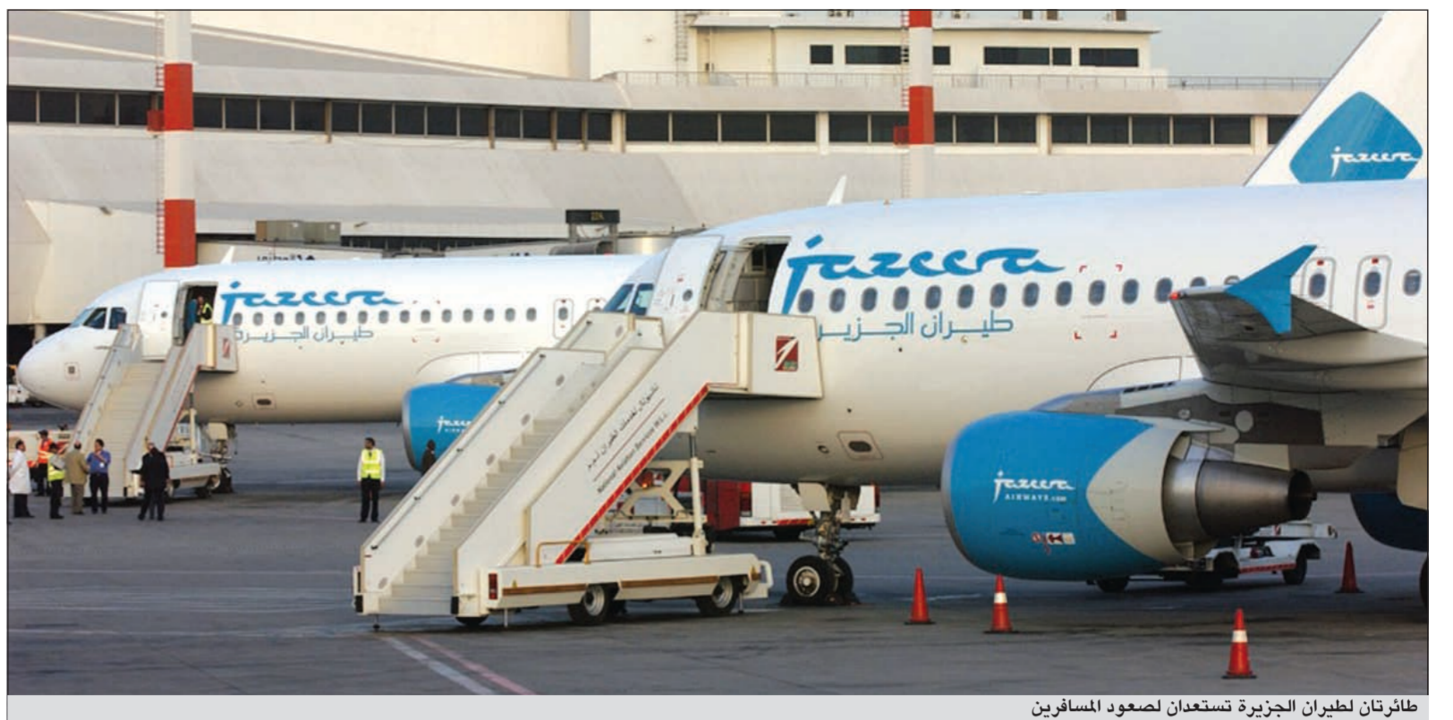
طارتان لطيران الجزيرة تستعدان لوصول المسافرين