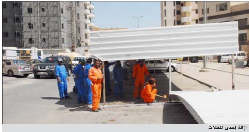
إزالة إحدى المظلات

أزالت بلدية الكويت 10 مظلات مخالفة مستخدمة كمواقف للسيارات بمنطقة شرق بعد ورود عدد من الشكاوى من الأهالي بالمنطقة نظراً لإقامتها على أملاك الدولة، إلى جانب تسببها في حجز المرافق العامة حيث تم إقامتها على الجزيرة الواقعة على كتف الطريق وذلك بتوجيهات مدير فرع بلدية محافظة العاصمة م.فالح الشمري بالتعاون مع إدارة الخدمات العامة بالبلدية من خلال توفيرها كل المعدات والأليات المستخدمة في عمليات الإزالة. وأشرف على إزالة المظلات المخالفة بعد إذار أصحابها على مدى أسبوعين مطلقين عن إدارة