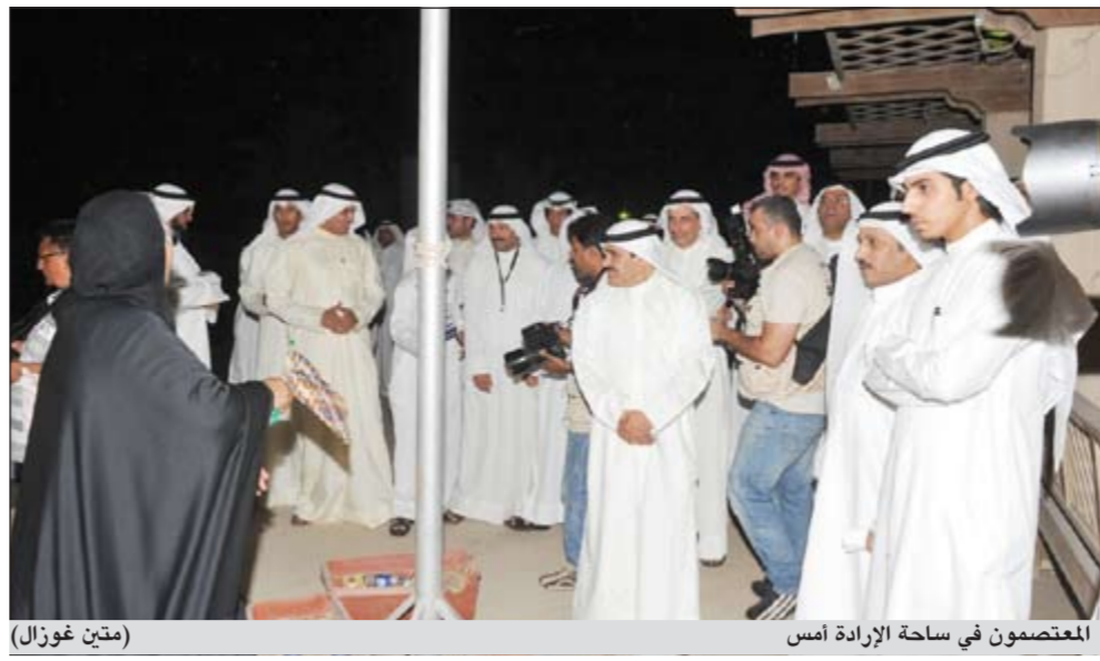
المعتصمون في ساحة الإرادة أمس