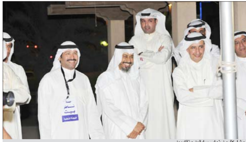
مشاركة من نواب سابقين ونقابيين