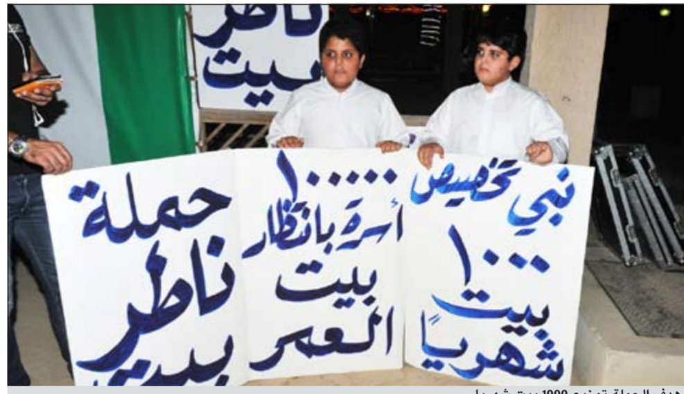
هدف الحملة توزيع 1000 بيت شهرياً

البلدية مهلهل الخالد يسأل حول قانونية قرارات اتخذها نواب مديري الإدارات. 3 هل سببها هؤلاء المكافآت التي يتخذونها تعتبر صحيحة وناذفة في ظل عدم وجود مسمياتهم ضمن الهيكل التنظيمي وذلك عدم وجود أئمة اختصاصات محددة لعملهم؟ 4 هل لدى البلدية دراسة لإعادة النظر في هذه المناصب من خلال إلغاءها وإعادة توزيع نواب مديري الإدارات على أقسام أخرى بمسميات موجودة في الهيكل التنظيمي وفقاً للشهادات التي يحملونها؟ 5 هل تقدم احد من المرشحين بشكوى أو طعن ضد أي قرارات اتخذها من يحملون هذا المنصب؟ 6 ألا يفترض من البلدية وقف هؤلاء الموظفين عن أداء عملهم لحين تعديل أوضاعهم وكذلك وقف صرف المكافآت التي يحصل عليها بعضهم وخصوصاً من حملة