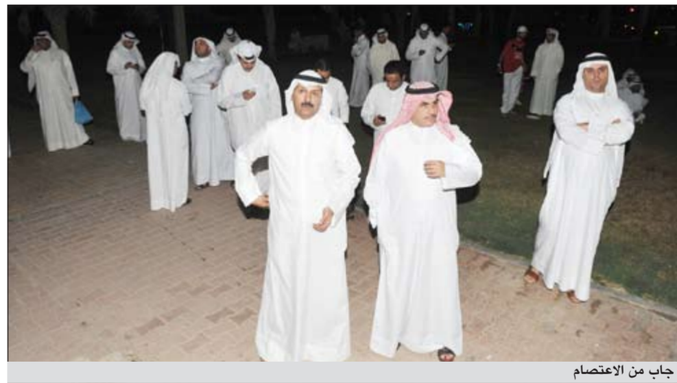
جانب من الاعتصام