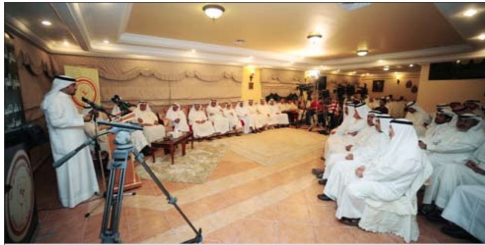
الحضور يتابعون الندوة