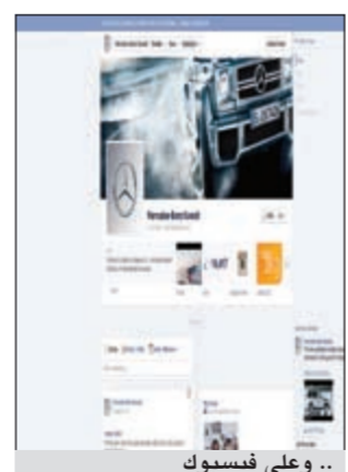
.. وعلى فيسبوك