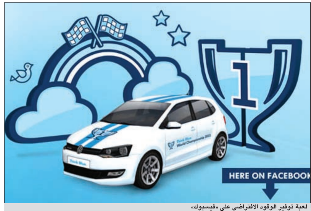
لعبة توفير الوقود الافتراضي على «فيسبوك»

لهذه البطولة العالمية». وأضاف للمشاركين عبر الإنترنت اللعب وحدهم فحسب، بل أيضاً ضد آخرين من أنحاء العالم، وذلك حتى التاسع من سبتمبر. إضافة إلى ذلك، تعد اللعبة تدريباً على مسابقة التفكير بالأزرق الإقليمية لتوفير الوقود، التي ستشهد حصول محقق أعلى النتائج على فرصة للمشاركة في النهائي الإقليمية في دبي، والتي بدورها ستشهد تأهل الفائز فيها إلى بطولة العالم للتفكير بالأزرق 2012 المقرر تنظيمها في شهر نوفمبر في كاليفورنيا، وستوج السائق الذي يستكمل السباق النهائي بأقل استهلاك للوقود مع إظهار وعي بالاستدامة البيئية بطلا