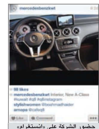
حضور الشركة على «انستغرام»

وهو أيضاً الجيل المشغوف بالإنترنت، فيكل سهولة تقوم قنوات التواصل الاجتماعي بتزويد العملاء وتمكينهم من متابعة آخر الأخبار والتطورات الخاصة بالنجمة الثلاثية الفارحة. ورغم حداثة إطلاقها، استطاعت قنوات التواصل