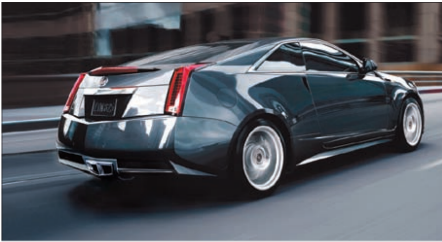
كاديلاك CTS كوبيه