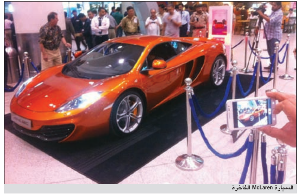
السيارة McLaren الفاخرة

الوطني الصيفية سنويا بتقديم أضخم الجوائز من الالامرغيني إلى المرسيديس SLS الفاخرة ما أكسبها نجاحاً لافتاً. واليوم يقدم الوطني فرصاً لربح إحدى أكثر السيارات رفاهية في العالم بالإضافة إلى جوائز نقدية لغاية 180 ألف دينار. ويمكن للراغبين في معرفة المزيد حول هذا العرض المغربي الاتصال بخدمة هلا وطني على الرقم 1801801 أو الدخول إلى موقعنا www.nbk.com أو زيارة أقرب فرع من فروع الوطني، كما يمكن التواصل من خلال حساب البنك على مواقع التواصل الاجتماعي فيسبوك NBK Official Page وتويتر NBKPage@ وانستغرام @NBKPage وتعتبر سيارة McLaren MP4-12C أبرز طراز من McLaren لما تتميز به من تصميم أنيق وقدرات مرتفعة بالإضافة إلى أدائها المتفوق. وقد وصلت هذه السيارة حديثاً إلى الكويت من خلال وكيل «McLaren Automotive» و«Ltd»، ومجموعة «BMW» في الكويت شركة علي الغانم وأولاده للسيارات.