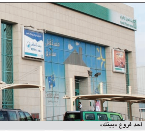
أحد فروع «بيتك»

أكد بيت التمويل الكويتي على تعزيز جهوده للاهتمام بكبار السن وذوي الاحتياجات الخاصة واتخاذ كل التدابير التي توفر لهاتين الشريحتين الهامتين الرعاية الحقيقية واللازمة التي تمكنهم من الاستفادة من جميع الخدمات التي يقدمها «بيتك»، بإيسر السبل، انطلاقاً من واجب وطني واجتماعي، وبتفعيل اللقيم الشرعية التي يعمل البنك وفقها، وأشار «بيتك» في بيان صحافي، إلى أنه استمررا للهدء الجهود وسعياً منه لتقديم أفضل الخدمات ومرعاة للظروف الخاصة تمثل هذه الفئات من العملاء، تعطى ووعه المنتشرة في مختلف المناطق الجغرافية الأولية في تقديم الخدمة لكبار السن وذوي الاحتياجات الخاصة، على أن يتم استثناء هاتين الفئتين من نظام الدور عند تقديم أي خدمة للعميل، إضافة إلى استثناءهما من رسوم السحب النقدي من داخل الفروع للمبالغ التي تقل عن 2000 دينار. وشدد «بيتك» على أن يتم استقبال هؤلاء العملاء وأنجز معاملاتهم بكل ترحاب واحترام، إضافة إلى تكليف مشرف الاستقبال بتوجيه هؤلاء العملاء إلى مدير الفرع أو مدير العمليات لتقوم بدوره بتحديد موظف لتفقد طلب العميل حسب إجراءات العمل المعمول بها داخل الفرع.