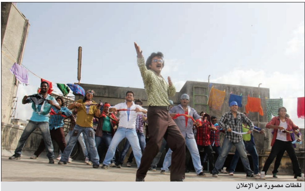
لقطات مصورة من الإعلان