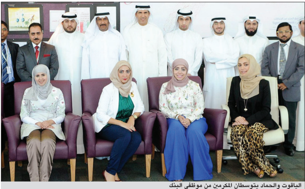
الياقوت والحمد بتوسطان المكرمين من موظفي البنك

الأخرى تضمن الاحتفال مع ذوي الاحتياجات الخاصة بواحدة من أهم العادات الكويتية القديمة وهي القرقيعان، وكان البنك الوحيد الذي نظم وعلى مدى أسبوعين كاملين أكثر من 10 احتفالات مع مختلف جمعيات ومؤسسات النفع العام التي تعنى بشؤون المعاقين وذوي الاحتياجات الخاصة وهو ما تلقى الترحيب من هذه المؤسسات التي أشادت بدور البنك في التعامل مع هذه الفئة التي يجب أن تلقى كل الدعم والمساندة. ومن أبرز الجمعيات التي احتفل معها بنك بوبيان بالقرقيعان مركز الداون بالخالدية والجمعية الكويتية لرعاية المكفوفين ومركز الخرافي لذوي الاحتياجات الخاصة ودور الرعاية الاجتماعية التابعة لوزارة الشؤون الاجتماعية والعمل التي جانب الاحتفال الذي نظمه بالتعاون مع جمعية أولياء أمور المعاقين الكويتية. من ناحية أخرى، كرم البنك أيضاً جاسم السنغوسي الفائز ببطولتي نادي المصارف للفردى والزوجي للبيلايردو والتي جرت فعالياتهما في شهر رمضان الماضي.