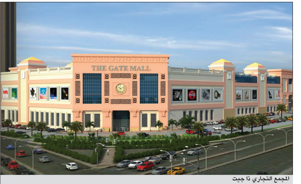
المجمع التجاري نا جيت