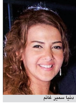
دنيا سمير غانم

رفضت الفنانة دنيا سمير غانم بطولة فيلم جديد بعنوان «البطيح والعبيط»، بسبب احتواء الدور على بعض المشاهد الجريئة التي تخشئ أداها، ورجحت مصادر بحسب موقع «دنيا الوطن»، قريبة من الوسط الفني أن يكون اعتذار دنيا جاء استجابة لرغبة خطيبها المذيع التلفزيوني رامي رضوان.