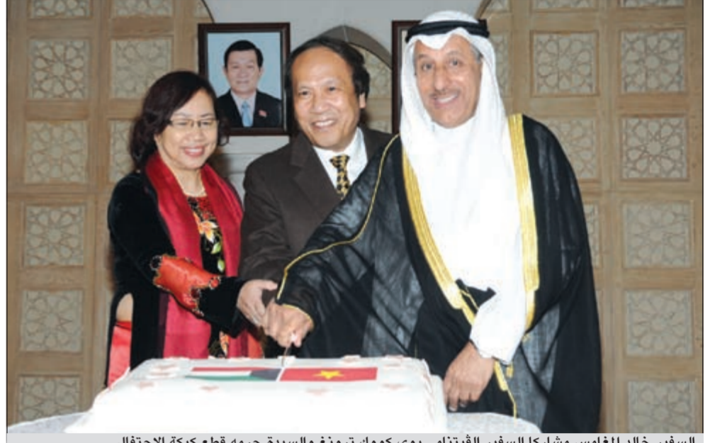
السفير خالد المغامس مشاركا السفير الفيتنامي بوي كووك ترونغ والسيدة حرمه قطع كيكه الاحتفال

أكد خلال الاحتفال بالذكرى الـ 67 لتأسيس فيتنام أن الأمور بين البلدين تسير في الاتجاه الصحيح