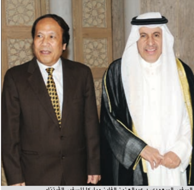
السفير السعودي د.عبد العزيز الغابن مباركا للسفير الفيتنامي