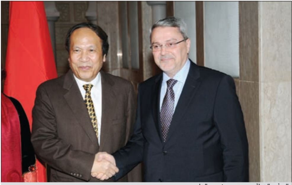
السفير العراقي محمد حسين بحر العلوم

وردا على سؤال عما اذا تم صيانة تلك العلامات قال هناك جدول زمني معد مسبقا مع الامم المتحدة والجانب العراقي والأمور تسير في الاتجاه الصحيح. وخلال مشاركته في الاحتفال