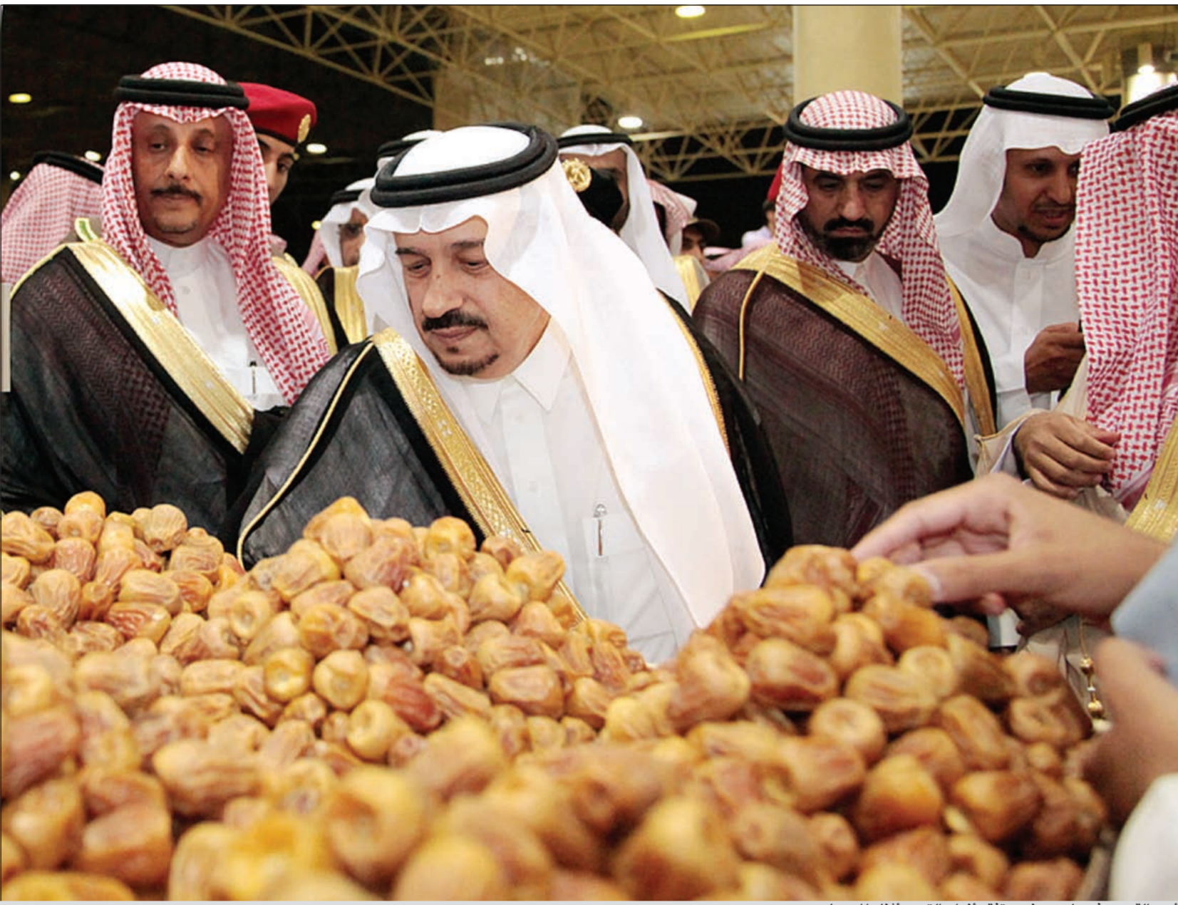
أمير القصيم فيصل بن بندر يتفقد أنواع التمور أثناء المهرجان