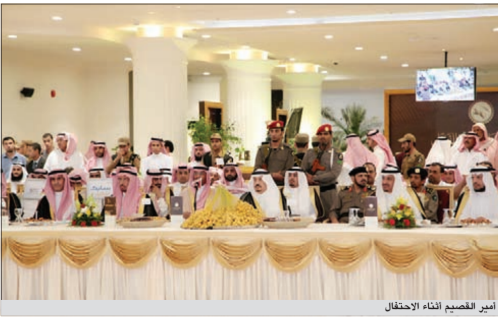
أمير القصيم أثناء الاحتفال

سعودي يرحب بإيصال خيرات بلاده إلى العالم ولكل إنسان على هذه الأرض. وشكر أمير القصيم جميع العاملين في مهرجان التمور وشكر كل زميل عمل ووقف في هذا المهرجان منذ بداية تأسيسه، ولنا 21 عاماً والزلاء يعملون فالحمص لله ظهرت النتائج والأمر جيدة فأننا اعتبر كل إنجاز يجبر لكل شخص عمل فيه وليس لشخص واحد فقط، أقدر التناغم الجيد بين القطاعين الخاص والعام، الذي فعلا من خلاله استطعنا أن نصل إلى هذا المستوى الجيد وإنجاز فيه ثمره يانعة لذينة، وأرجو أن نوفق إن شاء الله في كل مجال.