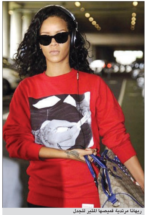
ريهانا مرتدية قميصها المثير للجدل

إيلاف: كعادتها، ظهرت مؤخراً مطربة البوب الشهيرة ريهانا بطلقة مثيرة للجدل في صالة الوصول بمطار هيثرو الإنجليزي وهي ترتدي قميصاً من النوع الثقيل مرسوم عليه يد مزينة بوشم وهي تمسك بما يعتقد أنه يبدو كسيجارة ملفوفة نصف لفة. وأرادت كذلك تنويرة «ماكسي» بفتحة حتى منطقة الفخذ، إلى جانب حقيبة يد من ابداع غوتشي، وساعات أذن كبيرة، تستمع من خلالها للموسيقى. لكن تقارير صحافية أوضحت أن تلك ليس المرة الأولى التي تخوض فيها ريهانا مغامرة مع عالم القب، حيث سبق لها أن ظهرت قبل أسبوعين وهي تتناول العشاء في لوس أنجليس مرتدية تي شيرت أبيض مزينا بصورة بيضاء وسوداء تكشف كيف يمكن أن تقوم بلف سيجارة فقط في ست خطوات. ومن المعروف أيضاً عن ريهانا (24 عاماً) ولعها بارتداء نوعية المجوهرات التي تصمم على شكل بنادق.