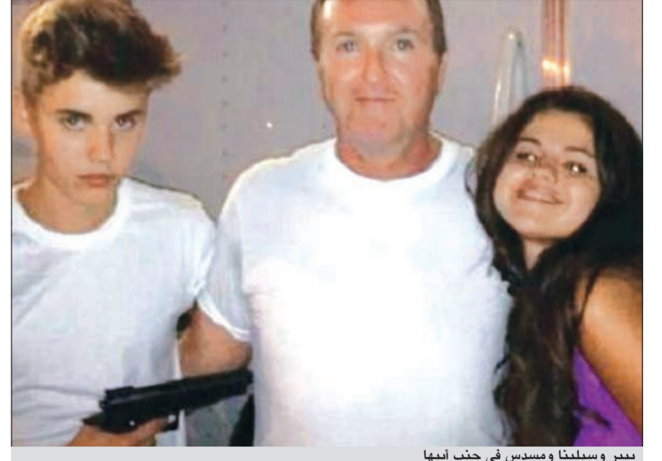
بيبير وسيلينا ومسدد في جنب أبيها

وكالات: هو اليوم أيقونة من أيقونات المراهقين في أميركا وحول العالم، معجبهه يعدون بعشرات الملايين، ولذلك فاي خطأ صغير يقوم به سيشكل حدثاً كبيراً. فبعد انتشارت صورة لجاستن بيبير تظهر فيها بيبير يرتكب خطأ جديداً، ولكن هذه المرة يتضمن الخطأ مسدساً قاتلاً. أيضا صديقه النجمة سيلينا غوميز ووالدها في كواليس تصوير فيلمهما الجديد، ولكن المشكلة الكبيرة أن جاستن يظهر في الصورة وهو يصوب