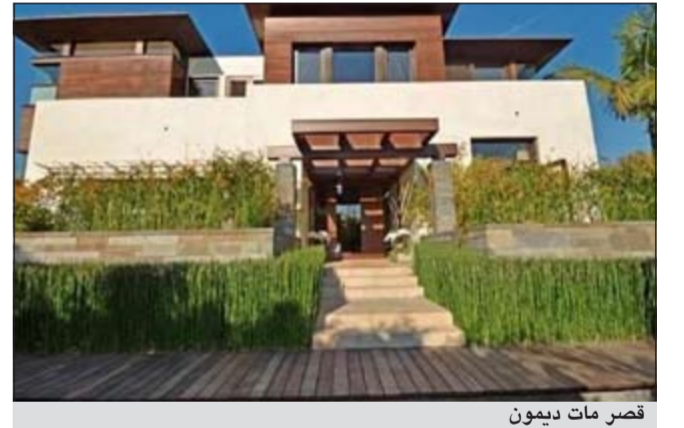
قصر مات ديمون

وكلات: حصلت أسرة الممثل الأميركي مات ديمون على منزل جديد حيث اشترى قصراً في ولاية كاليفورنيا بقيمة 15 مليون دولار.