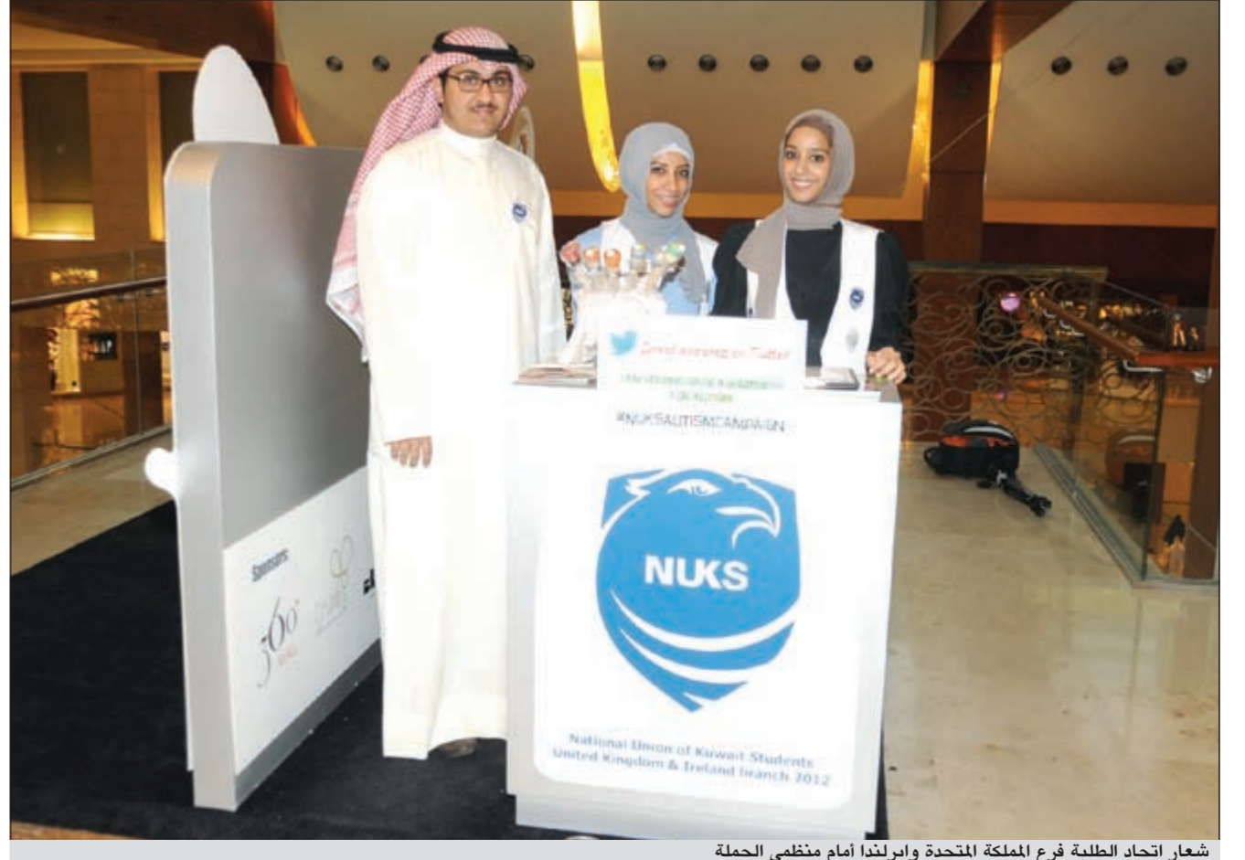
شعار اتحاد الطلبة فرع المملكة المتحدة وأيرلندا أمام منظمي الحملة