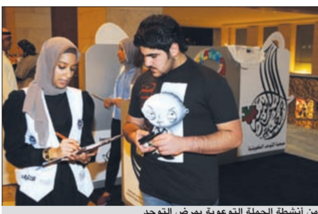
من أنشطة الحملة التوعوية بمرض التوحد