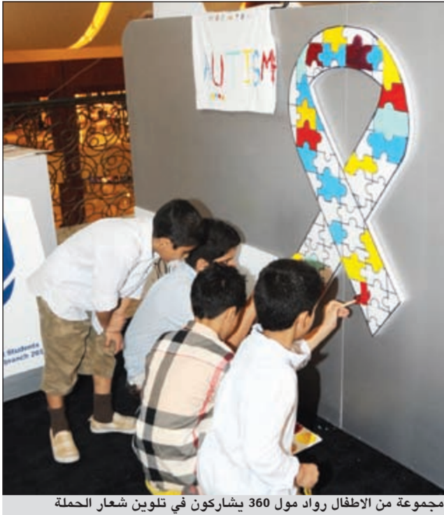
مجموعة من الاطفال رواد مول 360 يشاركون في تلوين شعار الحملة