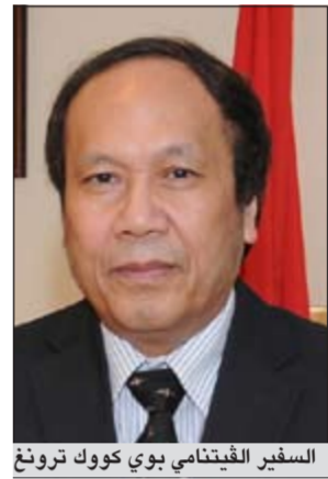
السفير الفيتنامي بوي كوك ترونغ

وأوضح ان متوسط النمو الاقتصادي لبلاده بلغ 7٪ وتم الحفاظ على الاستقرار السياسي والاجتماعي والأمني بحالة جيدة وأصبحت فيتنام إحدى الجهات