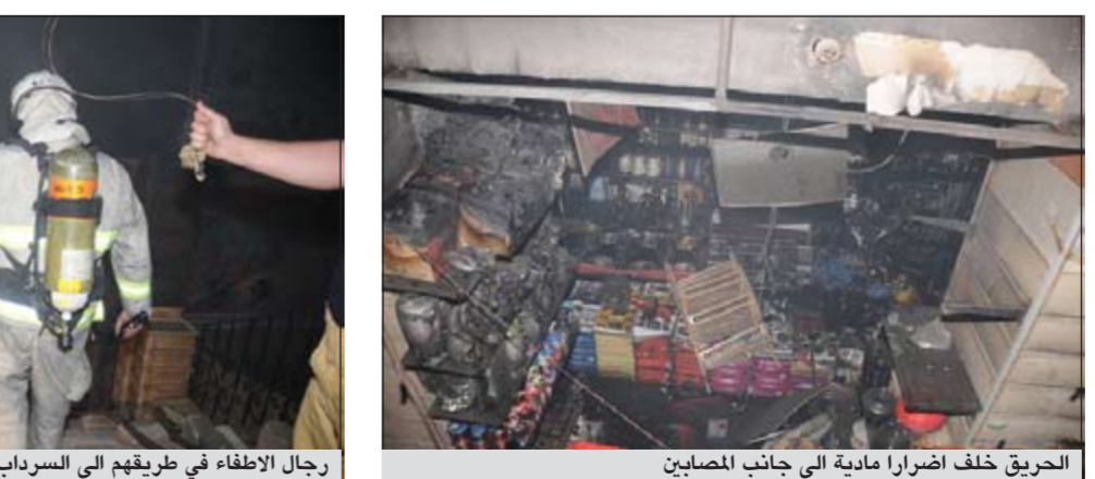
الحريق خلف اضرارا مادية الى جانب المصابين

باخماذ الحريق الواقع بالسرداب والذي يستخدم كسوق شعبي وتم استخدام اجهزة التهوية للتقليل من كثافة الدخان وفتح نوافذ السرداب والابواب وتم السيطرة على الحريق والحد من انتشاره.