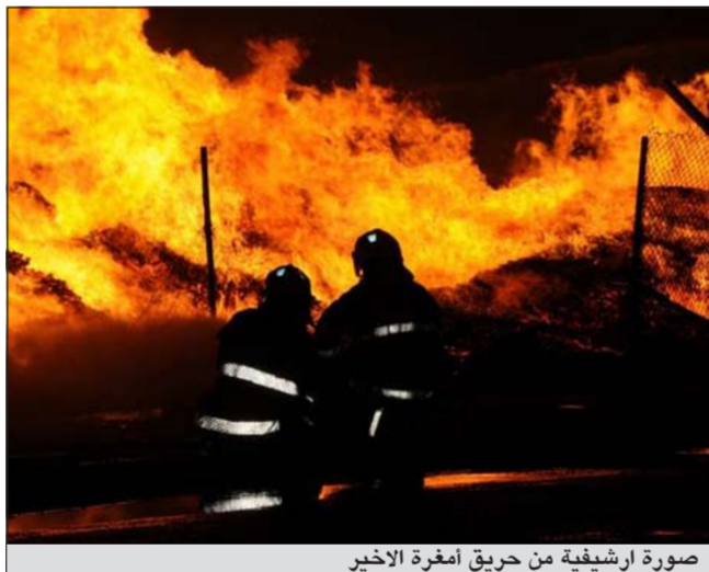
صورة ارشيفية من حريق أمفرة الاخير