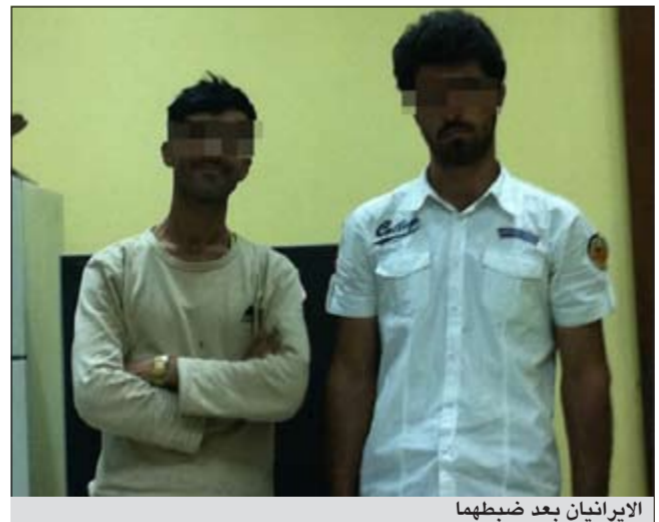
اليرانيين بعد ضبطهما