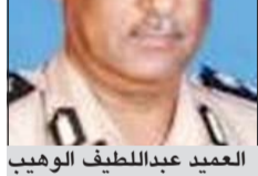
العميد عبداللطيف الوهيب