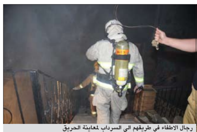
رجال الاطفاء في طريقهم الى السرداب لمعالجة الحريق

باخماذ الحريق الواقع بالسرداب والذي يستخدم كسوق شعبي وتم استخدام اجهزة التهوية للتقليل من كثافة الدخان وفتح نوافذ السرداب والابواب وتم السيطرة على الحريق والحد من انتشاره.