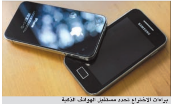
براءات الاختراع تحدد مستقبل الهواتف الذكية

الجزيئية الأميركية لوسي كوه الأمر في جلسة استماع لعدة لها يوم السادس من ديسمبر المقبل. وكان مؤسس آبل الرachel ستيف جوبز، قد أكد ان نظام «أندرويد» استنسخ من نظام «آي أو إس» الذي تعمل عليه أجهزة «آي فون» التي تنتجها آبل، لكن جوبز لم يقاض علقا البحث على الانترنت مباشرة، فضل ملاحقة المصنعين الذين يستخدمون نظام التشغيل الذي تنتجه غوغل، والذي يعتبر إلى حد بعيد أكثر شعبية في العالم.