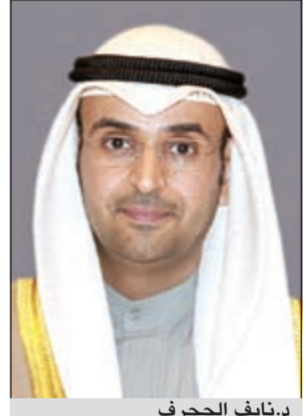
د. نايف الحجرف

جددت جمعية المعلمين تحفظها وموقفها الرافض لقرار وزارة التربية بحظر وجود أبناء الكوادر العاملة بمدارس التعليم العام من هيئات إشرافية وتعليمية وإدارية بنفس المدرسة مع أولياء أمورهم، مؤكدة أنها طلبت من وزير التربية ووزير التعليم العالي د. نايف الحجرف عقد لقاء عاجل لعرض وجهة نظرها وأسباب تحفظها على القرار وتداعياته السلبية إلى جانب طرح بعض القضايا العالقة والمتأخرة ومن ضمنها ما يتعلق بالوظائف الإشرافية والتخصص النادر. وذكر أمين سر الجمعية