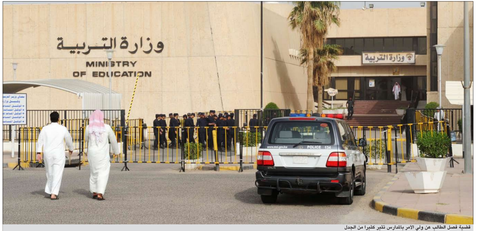
قضية فصل الطالب عن ولي الأمر بالمدارس تثير كثيراً من الجدل

تحفظ الجمعية جاء من واقع رؤية منطقية يجمع عليها أهل الميدان لدينا القناعة الكاملة بتفهم مسؤولي «التربية» لموقف الجمعية طالبت بعقد لقاء عاجل بوزير التربية لمناقشة قرار فصل الطالب عن ولي أمره في المدارس